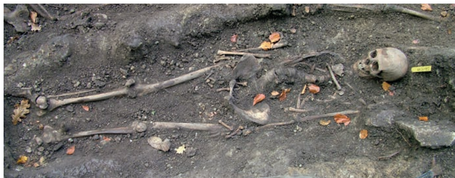
Figur 4. En av gravarna från 900-talet på det kristna gårdsgravfältet i Varnhem. De döda begravdes i öst-västlig riktning, i utsträckt ryggläge med raka armar.

Upptäckten av de tidiga gravarna i Varnhem kastar även nytt ljus över ett annat fyndkomplex i närområdet: den tidigkristna gravplatsen i Sântorp i Eggby socken. Här undersökte arkeologen Inga Lundström på 1960-talet ett stort antal gravar från olika tidsepoker, bl.a. ett 30-tal skelettgravar från 900-talets andra hälft och tidigt 1000-tal (Lundström & Theliander 2004 s. 76 ff.). Dessa till synes kristna begravningar fanns inom en rund yta som begränsades av stående kalkstenshällar i ring. I några av gravarna fanns föremål av precis samma typ som hittats i gravarna i Varnhem – framför allt knivar, brynen, pärlor, mynt och ringspännen. Gravplatsen hade använts av ett par tre generationer innan begravningarna upphörde några decennier in på 1000-talet. Här fanns inga spår