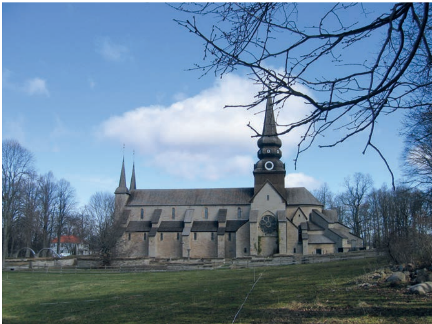
Figur 1. Varnhems klosterkyrka i centrala Västergötland.

husgrunder, gårdskyrka, stor kristen begravningsplats och förhistoriska gravar tecknar bilden av en betydelsefull storgård med rötter långt tillbaka i järnåldern.