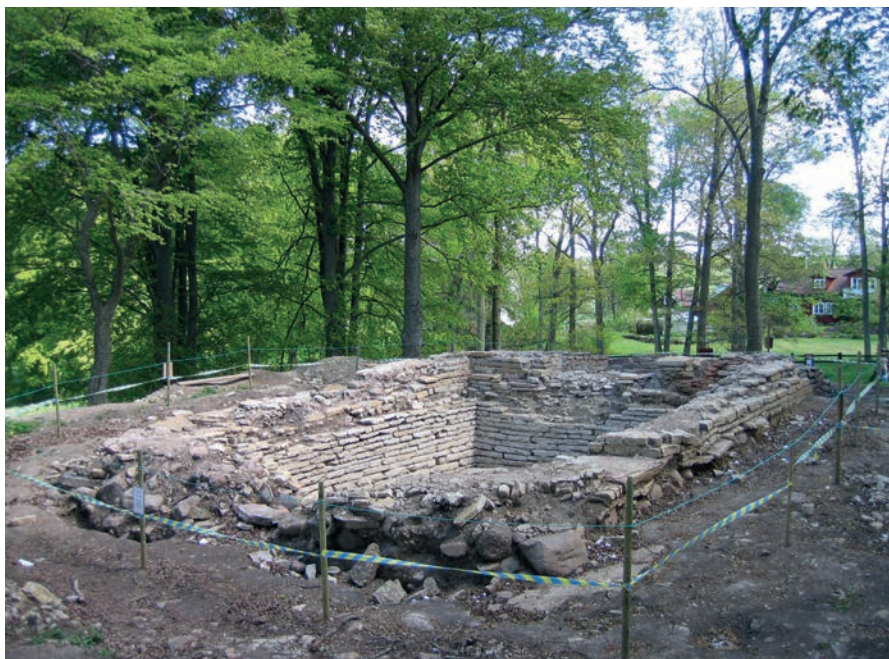
Figur 3. Grunden efter gårdskyrkan i Varnhem. Stenkällaren under långhuset byggdes i mitten av 1000-talet.

til karþi stan þinsi aftR katu kunu sina sustur þurils 'Kättil gjorde denna sten efter Kata sin hustru Torgils syster'. Här får vi namnet på tre personer ur den lokala aristokratin vid 1000-talets mitt. I återfyllningen i kanten av nedgrävningen till källaren påträffades ett par gravar som tillkommit efter det att källaren byggts. Under ett av skeletten hittades ett tyskt mynt (Bruno III),präglat mellan åren 1038 och 1052 (Vretemark & Axelsson manus 2014).