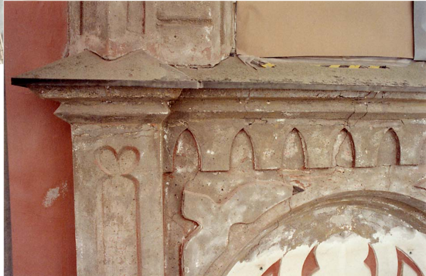
Ovan & t.h.: När sentida färglager blästrats av framkom dels att den befintliga putsen bör ha varit ursprunglig, dels äldre färglager i grått. Foto i mars 2005, 05/15:11A & 15A.