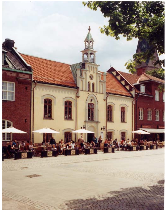
Ovan t.v: Rådhuset under fasadarbetet i april 2005. Cafédets utservering möblerade i Mellansvenska Fasads lastbilsflak. T. h. Rådhuset färdigrenoverat, maj 2005. 05/22:27A & 05/52:28A