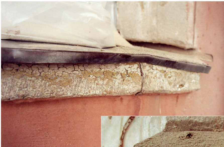
T.v. och nedan: Fönstrens solbänkar och delar av det dekorativa listverket visade sig vara skrädhuggen kalksten. Foto i mars 2005, 05/15:13A & 21A.