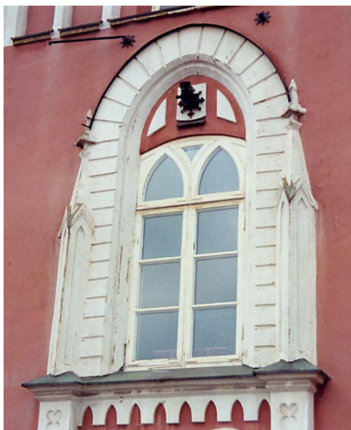
Alla puts- och stendetaljer var, liksom samtliga fönster- snickerier, målade vita sedan 1950-talet. Foto i apr. 2002.