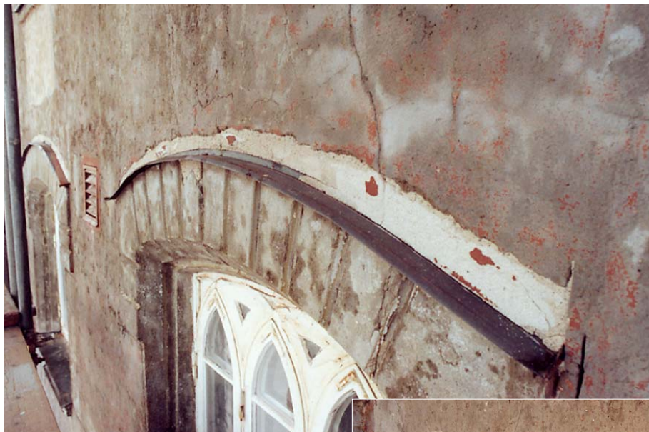
Tidigare lagningar med kalkbruk ersattes med KC-bruk liknande fasadputsen. Foto i mars 2005, 05/13:4A resp. april 2005, 05/16:5A.