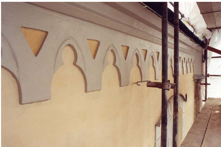
Ovan: Alla putsdetaljer i listverken målades med ljusgrå linoljefärg (grön umbra), fasadytorna med KC-färg i ljusgul kulör (obränd terra). Foto i maj 2005. 05/23:3A.