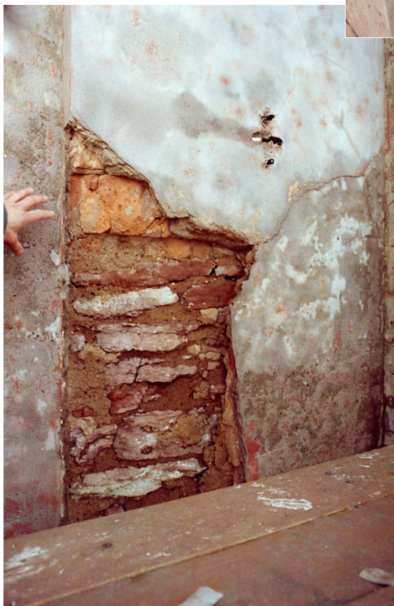
Ett parti av fasaden norr om entrén behövde putsas om. Stommen (på detta ställe) innehöll såväl kalksten som tegel. Foto i mars 2005. 05/13:3A.