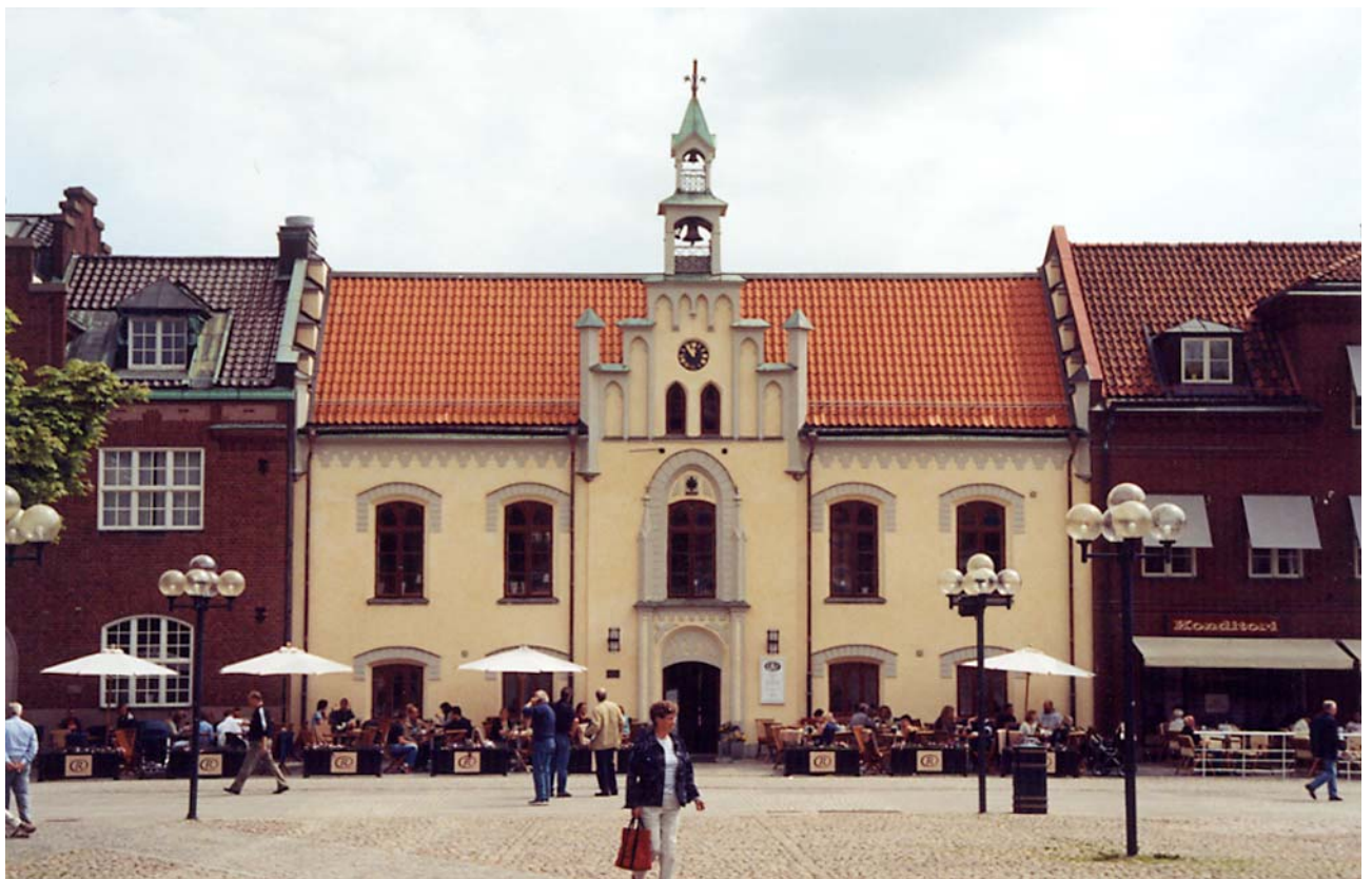
Rådhusets fasad mot Hertig Johans torg, återställd till sitt 1800-talsutseende. Foto i maj 2005. 05/52:27A.