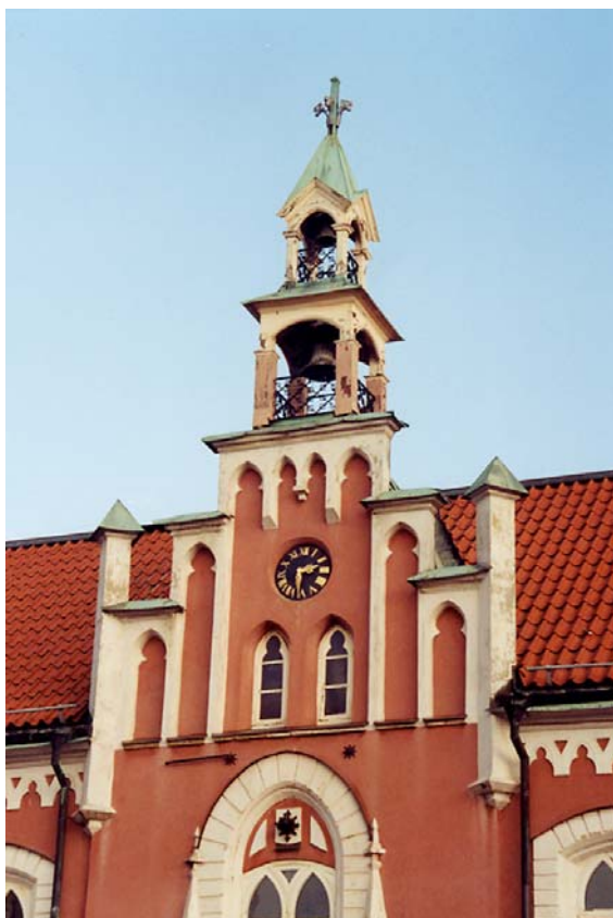
Frontespisen med klocktornet före renoveringen. Foto i febr 2005, 05/8:5.