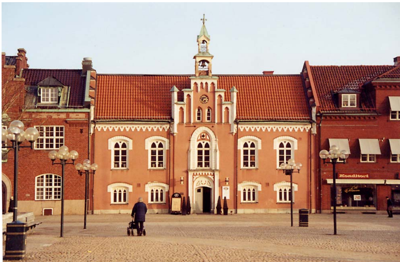
Rådhusets fasad mot Hertig Johans torg före renoveringen, foto i febr. 2005.