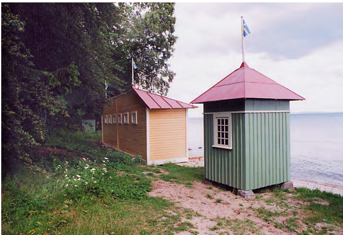
Det norra halvhuset och den nordligaste badhytten. 14 jun. 2011.