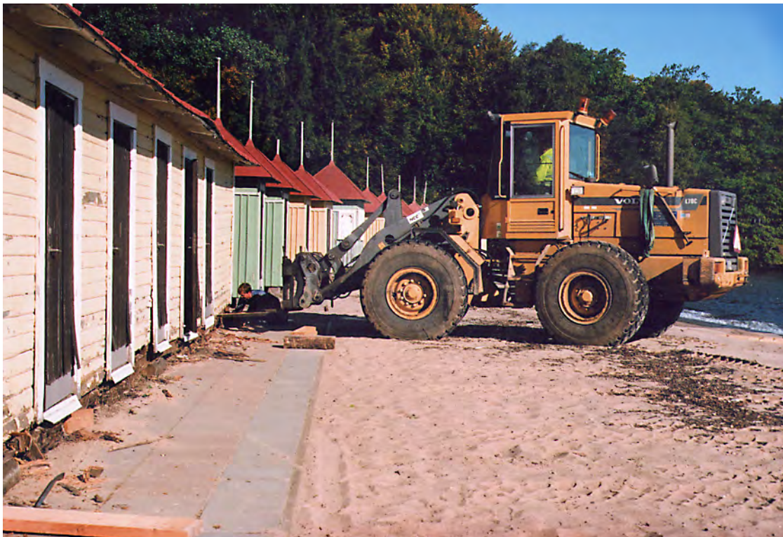
Försök att med hjälp av frontlastare lyfta huset inför syllbyte. Sept. 2010. 10/30:28A.