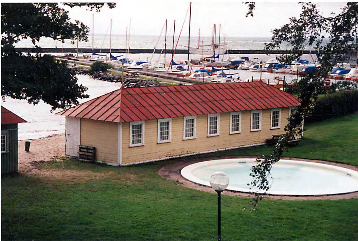
Den södra av de båda större badhyttshusen med småbåtshamnen i bakgrunden. Aug. 2008.