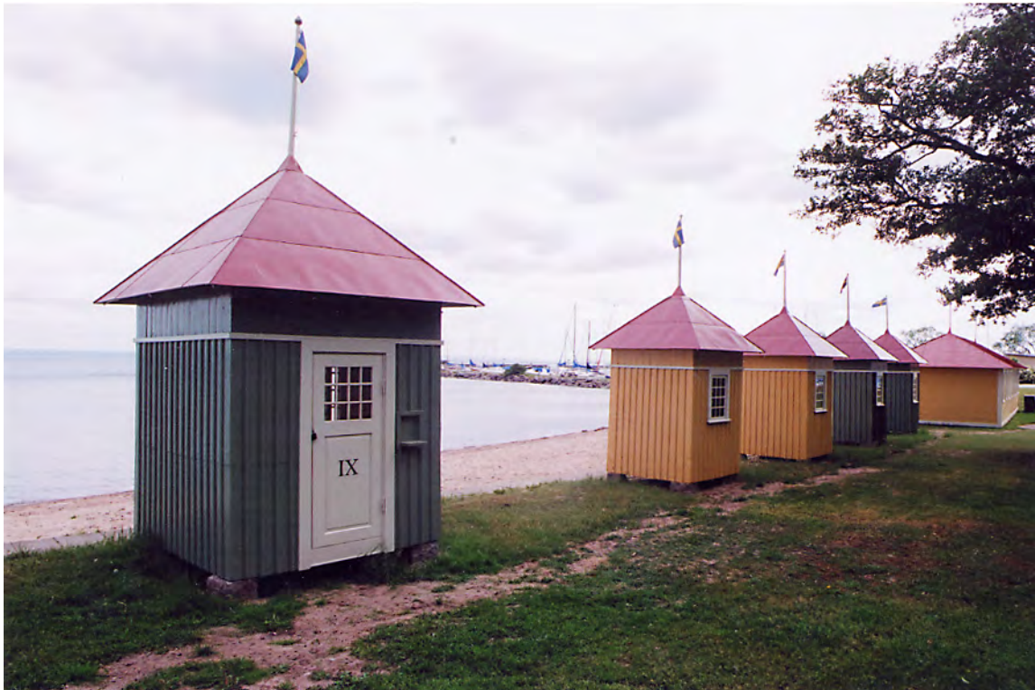
Biljettkiosken till vänster är den enda som har en dörr in mot land. Här var den ursprungliga entrén till badet. De fyra södra hytterna till höger. 14 jun. 2011.