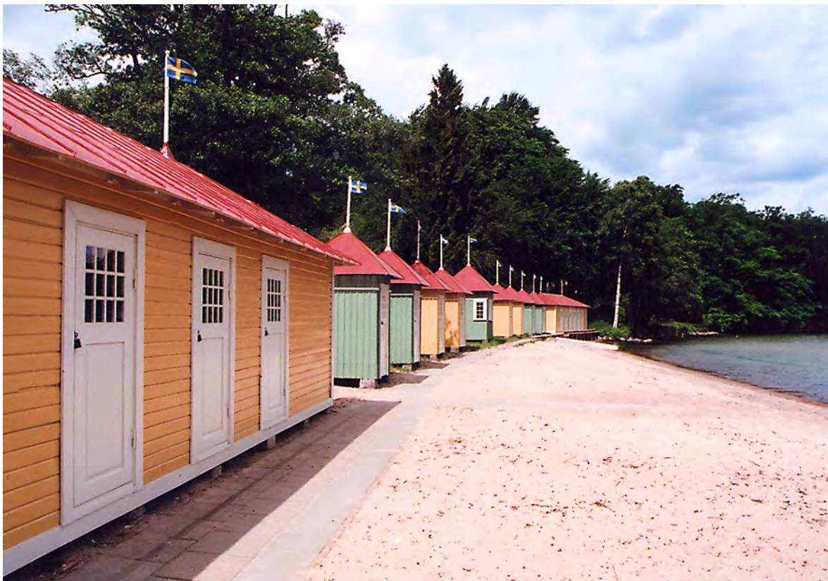
Som ovan. Badhyttshusen fick liksom alla fristående badhytter nya flaggstänger. 14 jun. 2011.