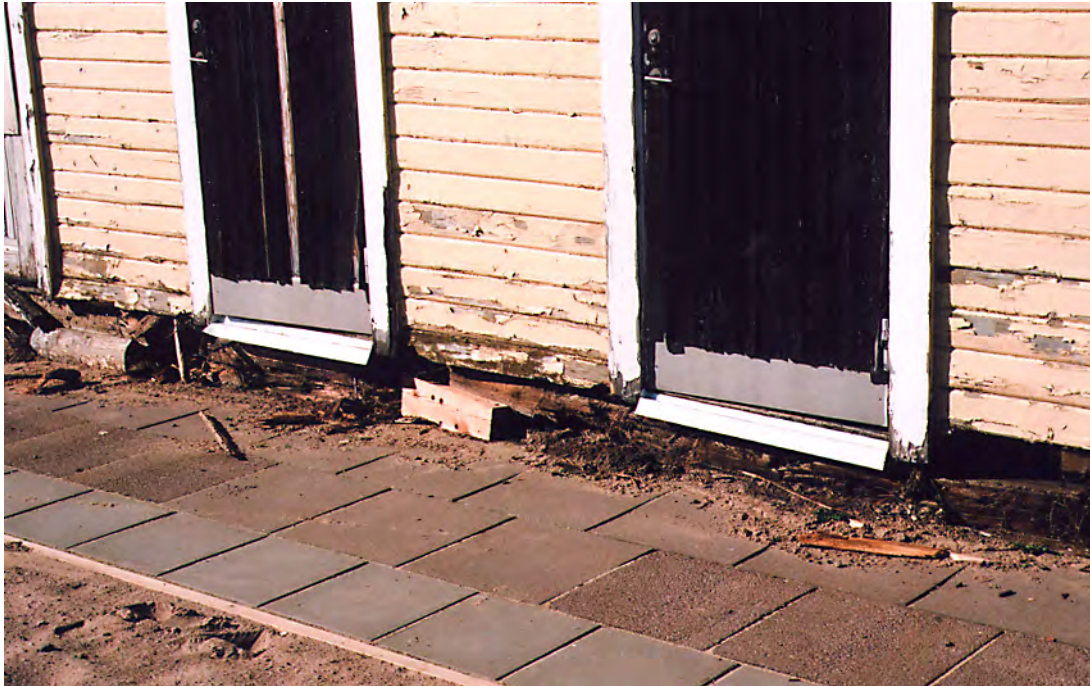
Syllarna på det södra, större huset hade tagit stor skada av att ligga för lågt. 29 sep. 2010. 10/32:22A.