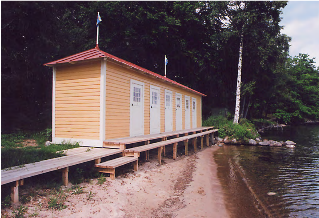
Halvhuset med nya flaggstänger. Här byggdes även en ny brygga framför hytterna. 14 jun. 2011.