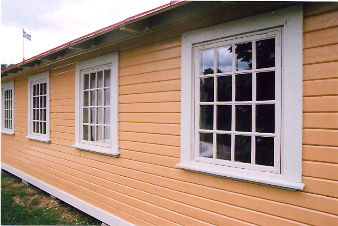
Södra badhyttshuset, fasad mot land (väster). 14 jun. 2011.