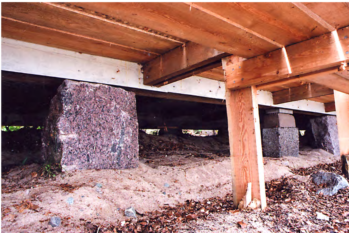
Även på detta hus justerades grundstenarna. 14 jun. 2011.