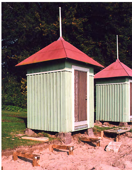
Ovan: Grundstenarna höjda 15-20 cm och hytterna återplacerade. 24 sep. 2010. 10/30:32A.

Vänster: Grundstenarna lyftes upp och återplaceras på en högre nivå. Från SLA 24 sep. 2010.