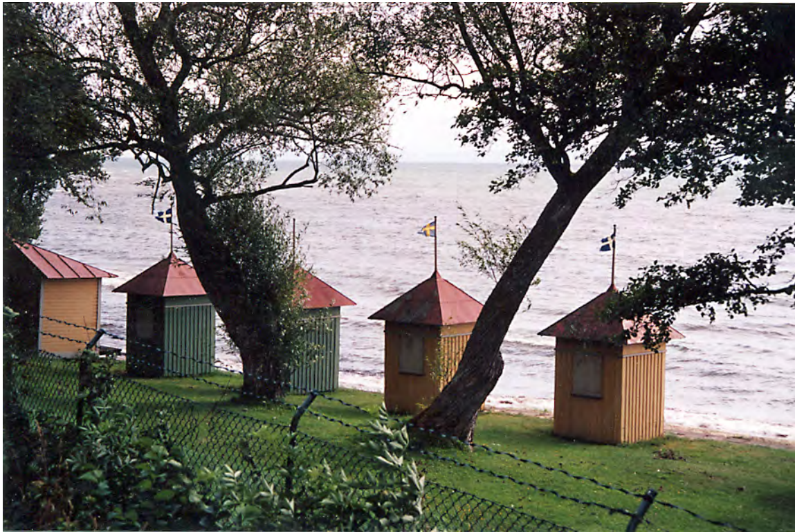
Badhytterna före renoveringen med Vättern i bakgrunden. Aug. 2008.