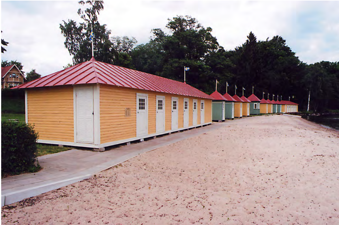
Badhytterna sedda från söder efter renovering. 14 jun. 2011.