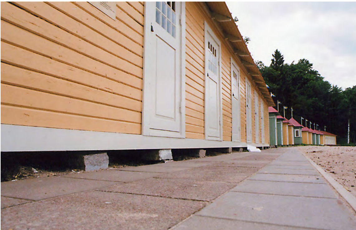
Huset står nu någon dryg dm högre än före renoveringen. 14 jun. 2011.