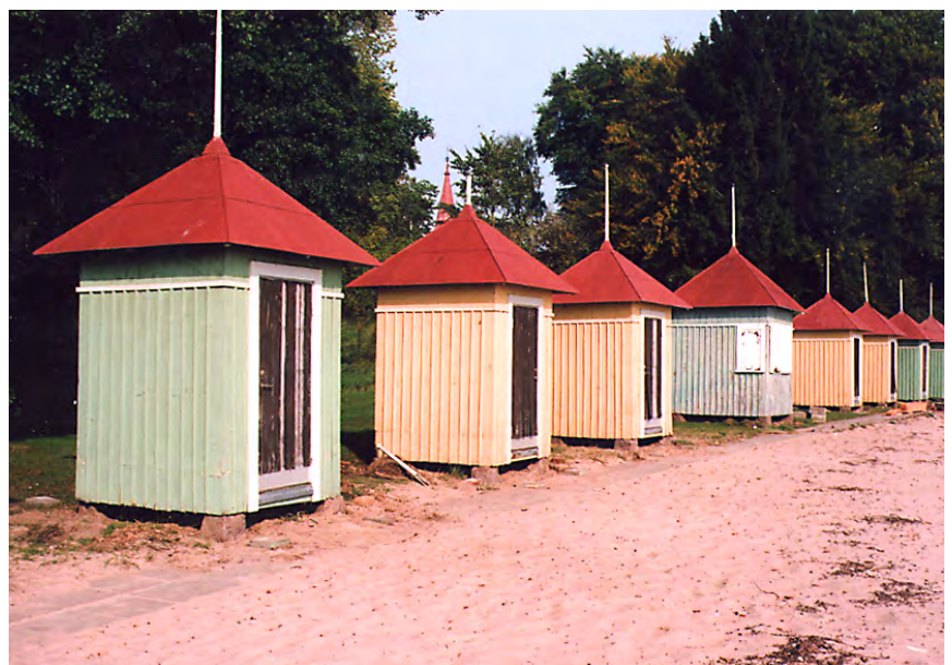
Badhytterna 24 sept. 2010. 10/30:31A.