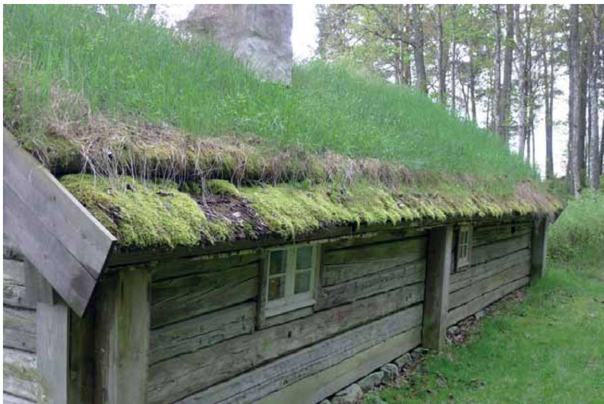
Hyringastugan, takfallet mot skogen. Vassen kraftigt mossbelupen. Mullstocken rötskadad. Maj 2014.