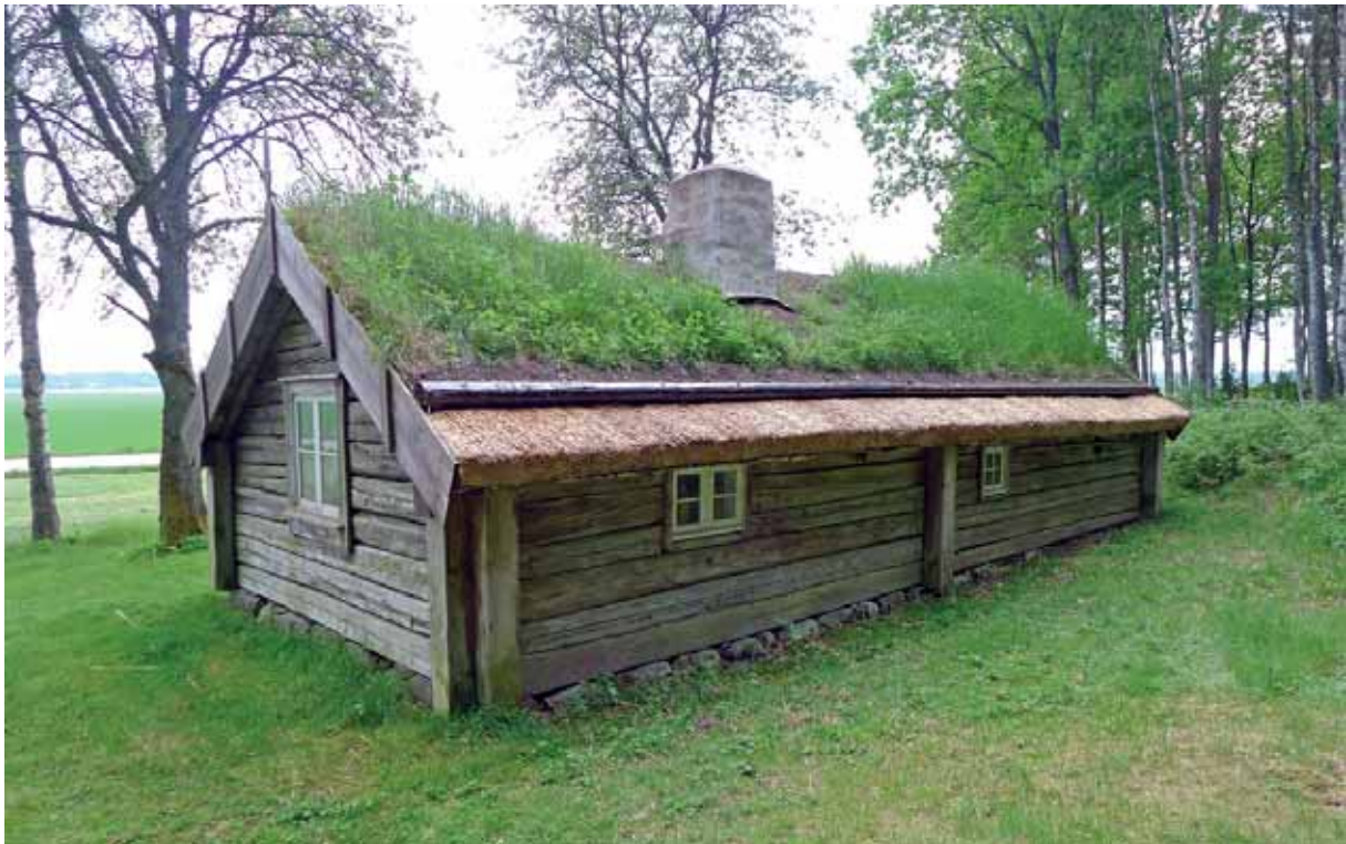
Som ovan. Fasad mot skogen. Maj 2014.