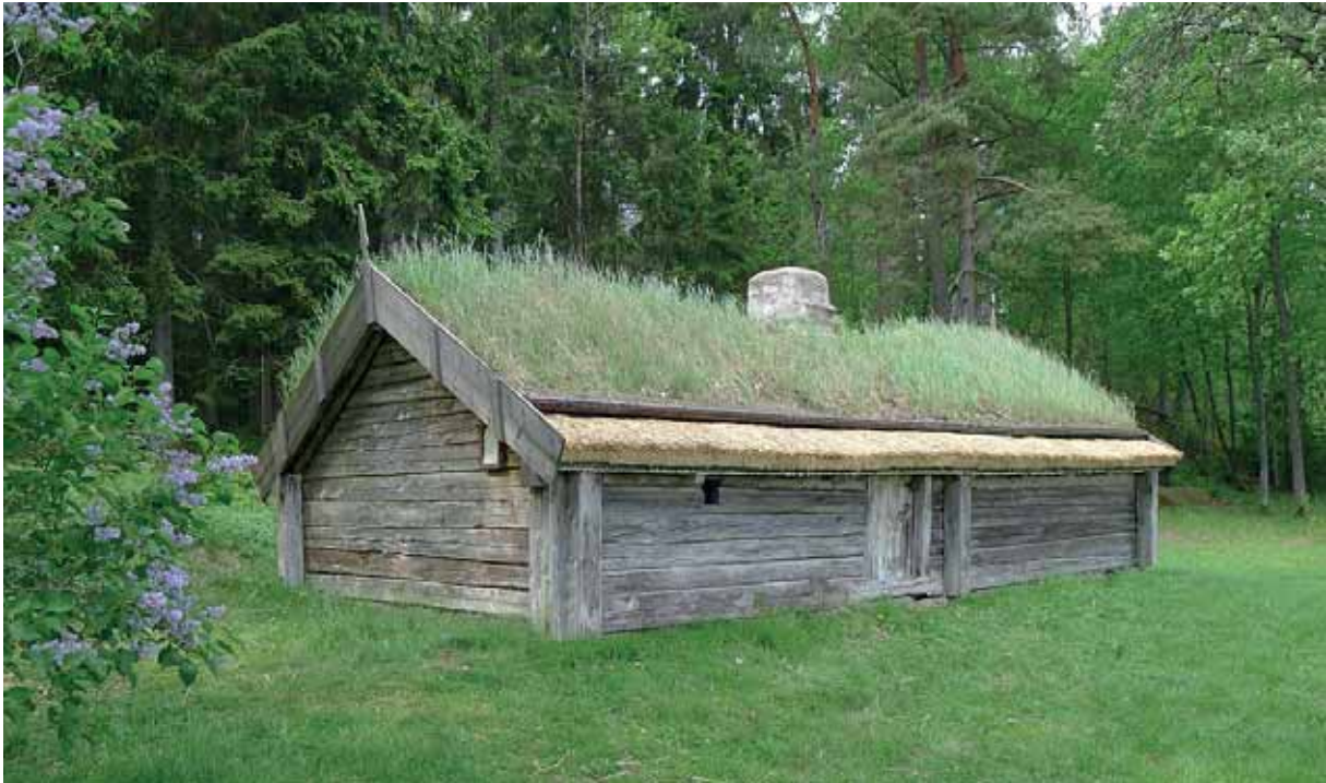
Vasstäckningen färdig och en ny tjärstruken mullstock har ersatt den skadade. Fasad mot vägen. Maj 2014.