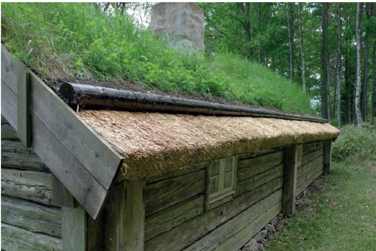
Takfoten mot skogen. Det är viktigt att mullstockarna i fortsättningen hålls fria från överväxning av torvens gräs, då de på detta sätt kommer att vara längre. Maj 2014.