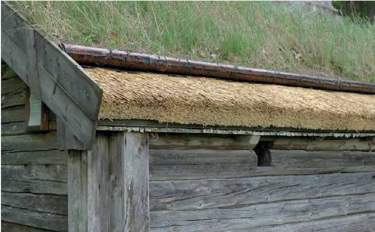
Detalj av takfoten på framsidan. Man kan vagt skönja de båda lagren vass. Maj 2014.