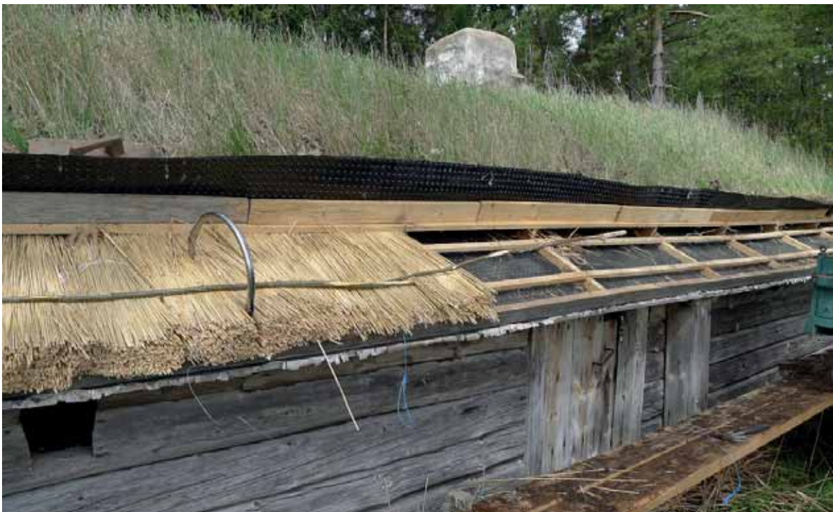
Vassen binds med ståltråd och en specialtillverkad rund nål som når ner under läkten. Det andra lagret vass binds sedan ner runt täckespröten. Maj 2014.