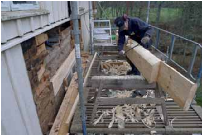
Magnus Ek på K-Märkt Byggnadsvård bearbetar en ersättningsstock vid skadan. Nov. 2012.