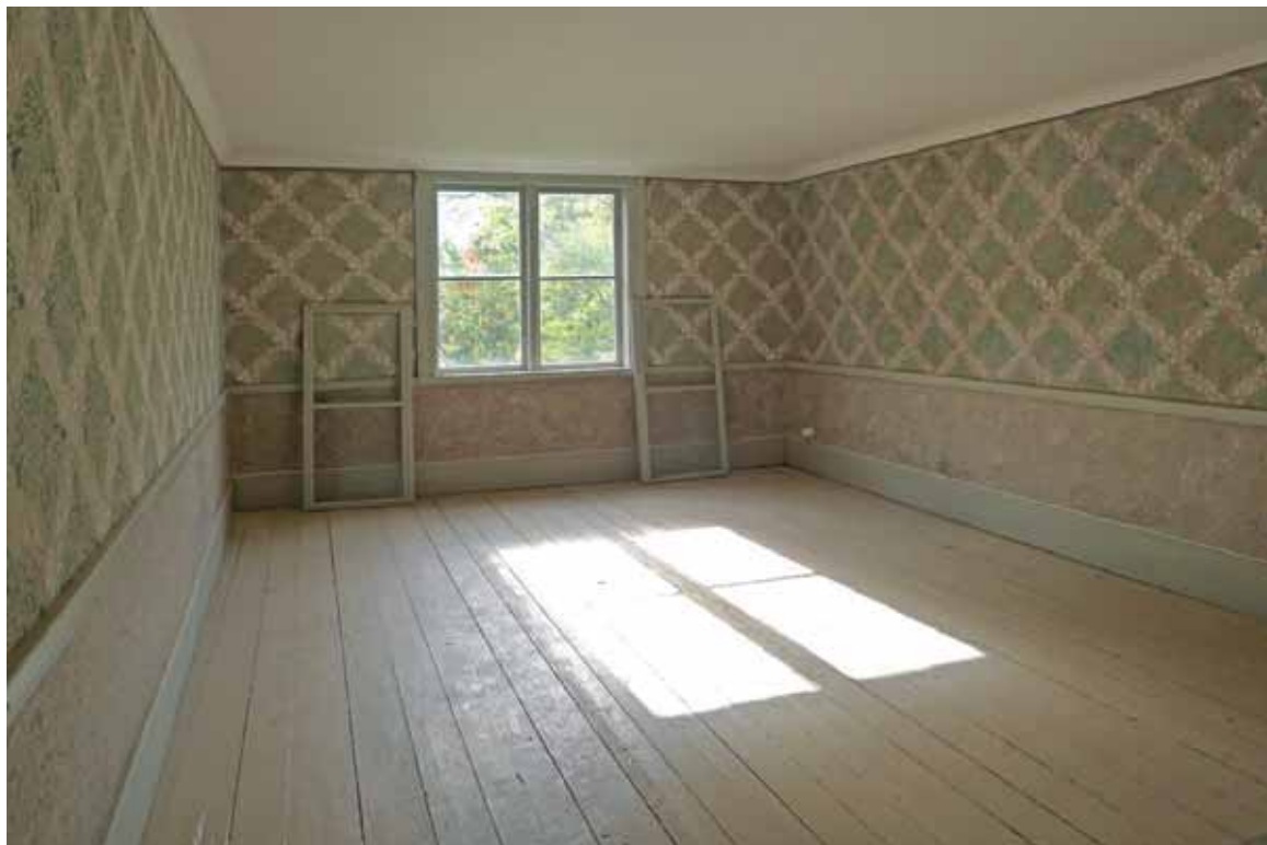
SO kammaren färdigställd. Lösa innerbågar inför montering. Sept. 2013.