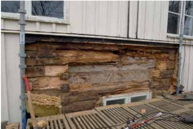
När fasadpanelen togs bort framkom omfattningen av röt-skadan. Nov. 2012.