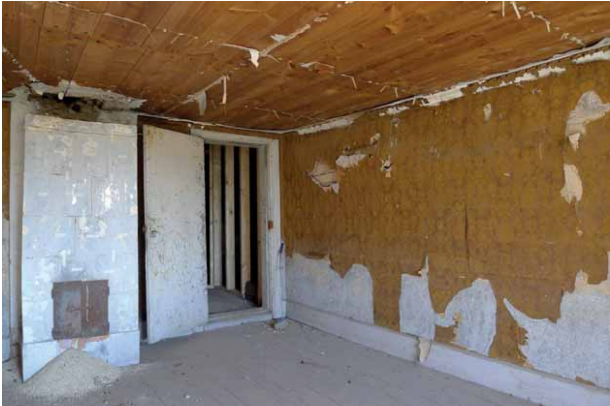
Även i SO vindskammaren var det spända taket nedrivet före åtgärderna. Juli 2012.