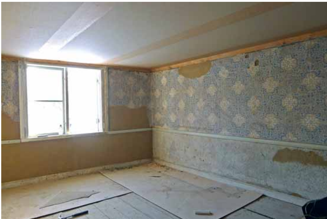
SV kammaren. Den nya mittelbandslisten monterad. De bruna partierna är ny lerklining. Febr. 2013.