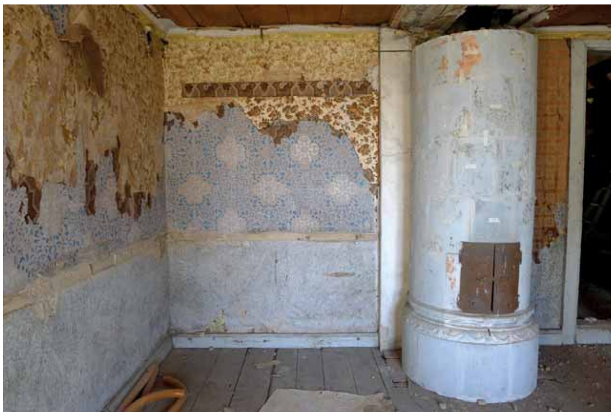
Lilla Bjurum, SV vindskammaren sedan en del av papperstapeterna rivits ned. Foto i mars 2012.