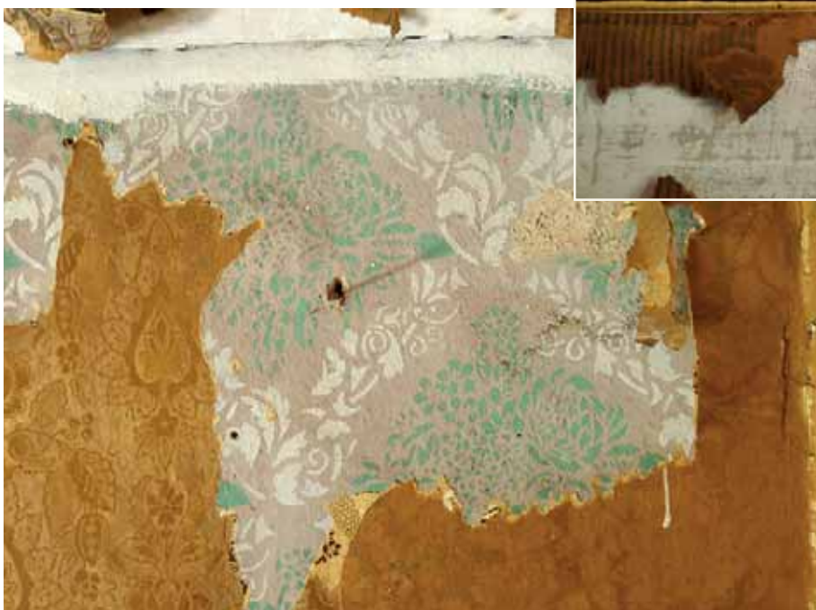
SO vindskammaren; Även i detta rum uppdagades en underliggande schablonmålning under papperstapeter, här endast två lager, ca 1880 och ca 1920. Till 20-talstapeten hörde en smal bård med förgyllda blad med stor lyskraft. Juli 2012.