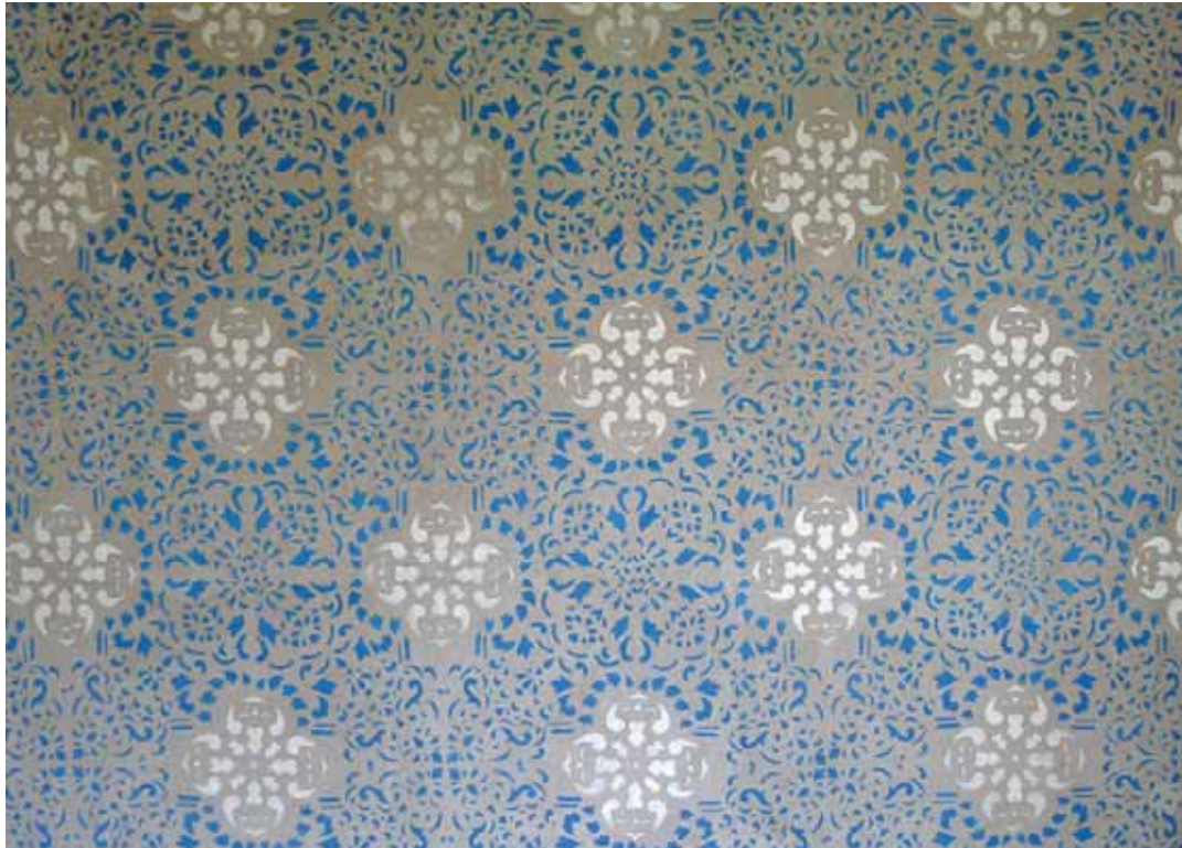
Det blå-vita mönstret i SV kammaren. Juni 2013.