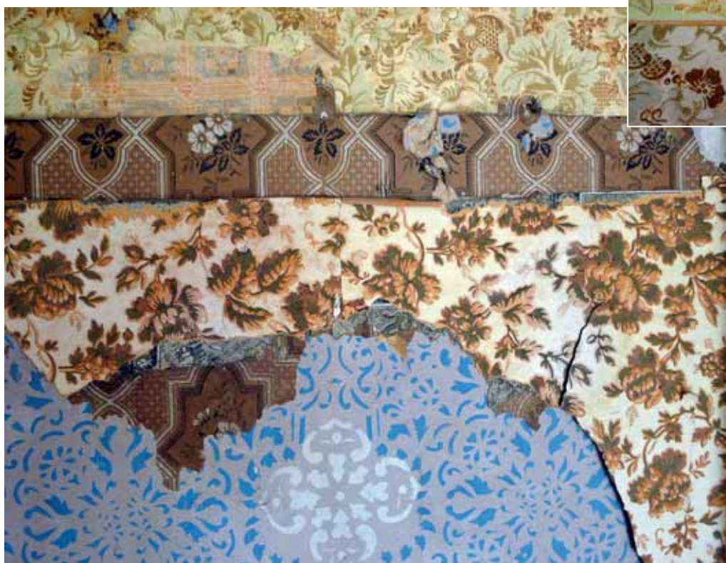
SV vindskammaren; Sedan schablonmål- ningen blivit omodern hade den tapetsrats över sex à sju gång- er, först ca 1870 och senast på 1920-talet. Detaljen: Till den yngsta tapeten hörde en bård med blom- och bladmotiv. Mars 2012.