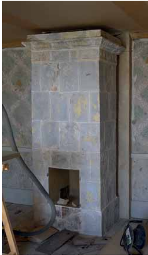
SV kammaren och SO kammaren - kakelugnarna återuppsatta. April 2013.