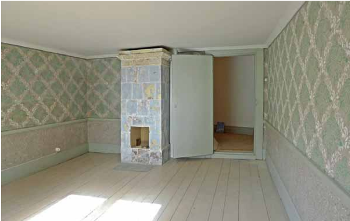
SO kammaren färdigställd. Sept. 2013.