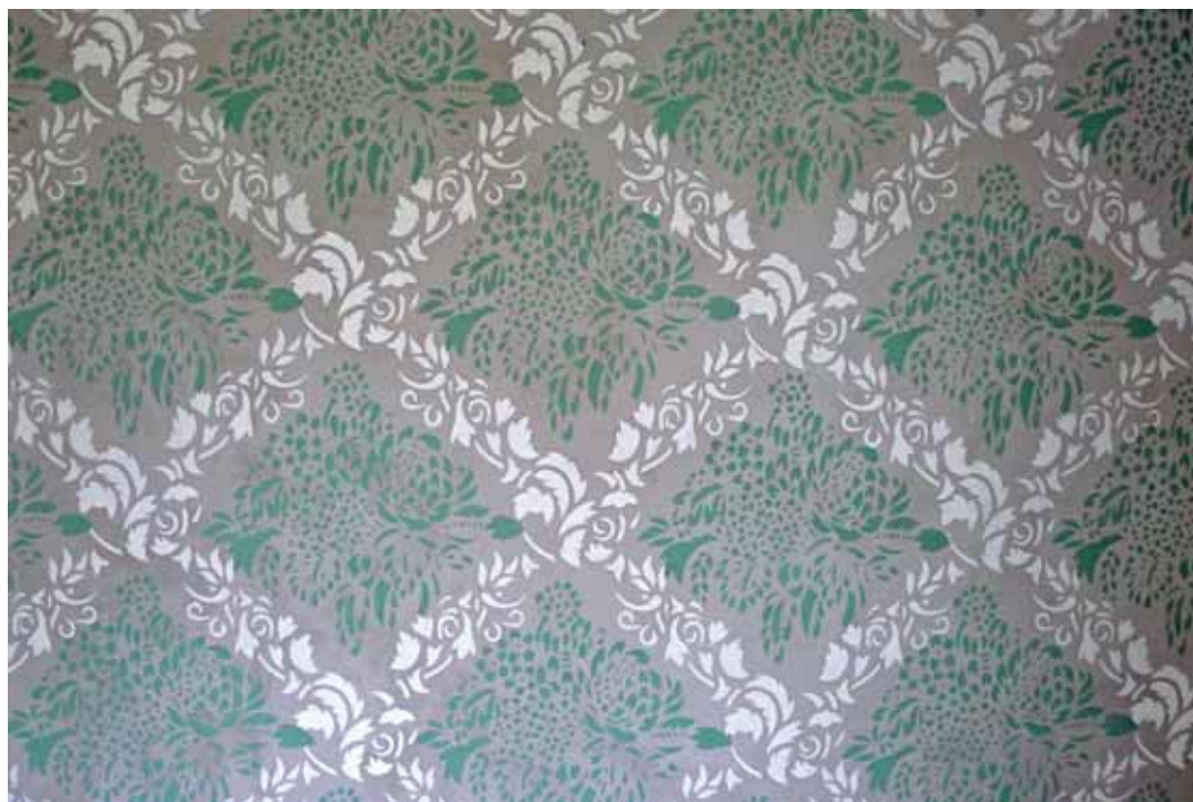
Det grön-vita mönstret i SO kammaren. Juni 2013.