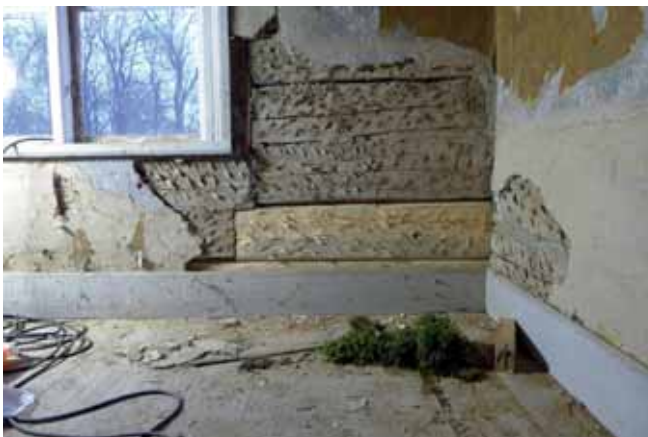
Lagningen sedd från insidan. Mossa användes för traditionell tätning mellan stockarna. Nov. 2012.