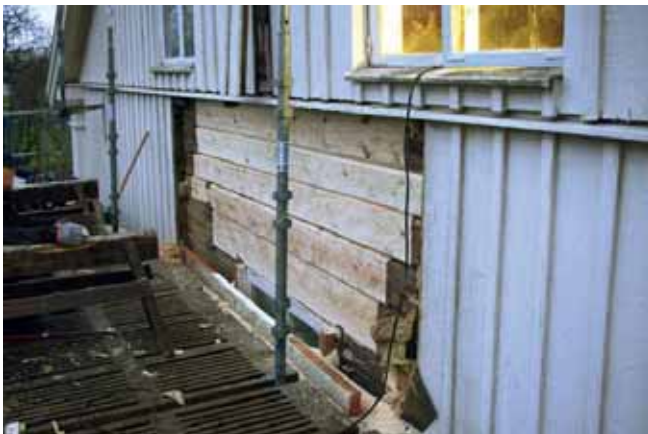
Den stora rötskadan åtgärdad. Foto MR nov. 2012.