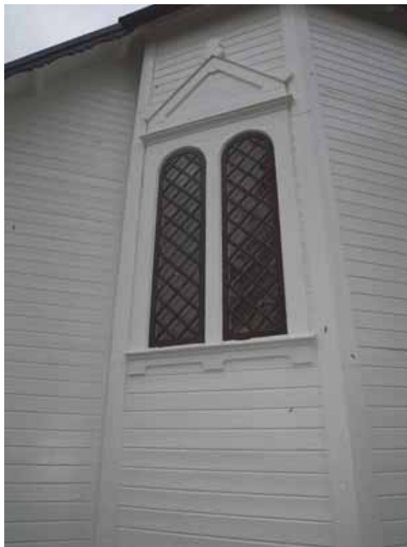
Bild 14: Färdigrenoverade och målade fönster på koravslutningen i Ö.

VGM_jenbj8_Hällestads_kyrka_ommålning_2013-10-23_5.jpeg