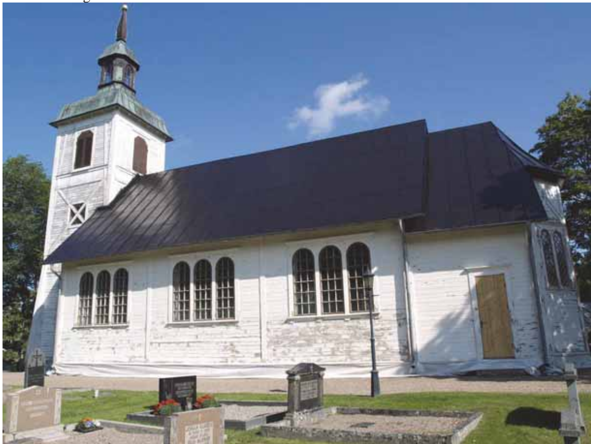
Bild 8 Taket färdigmålat, S takfallet.

VGM_jenbj8_Hällestads_kyrka_ommålning_2013-07-09_2.jpeg