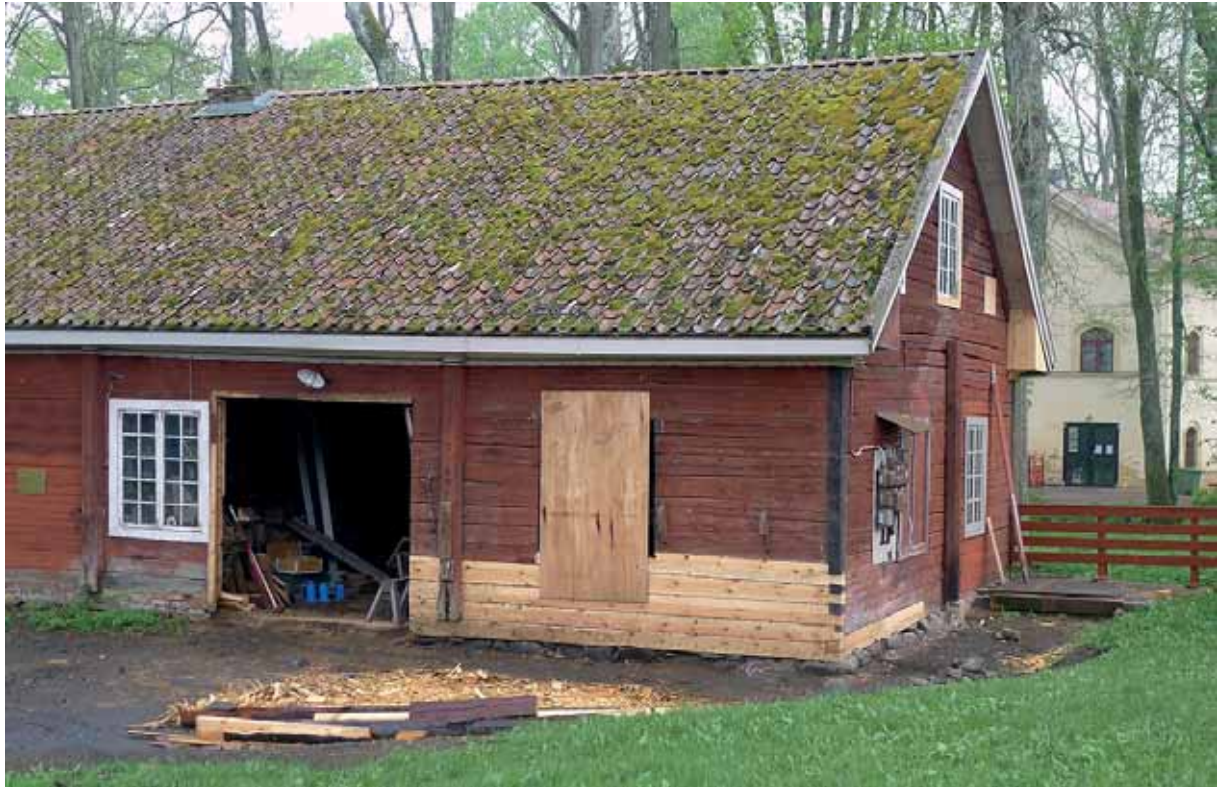
Långväggen mot norr med renoverat parti mellan hörnet och portarna. Maj -13.