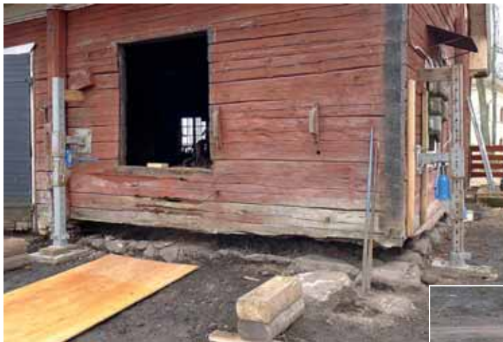
Vänster: Huset lyftes någon dm på domkrafter och de dåliga delarna togs bort. Långväggen mot norr, där inte bara syllan var skadad. Apr. -13.