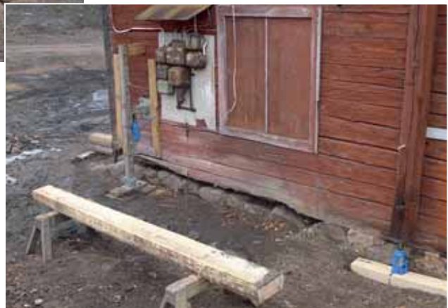
Höger: Västra gaveln; en ny stock förbereds för det skadade partiet av syllan. Den gamla elcentralen har fått sitta kvar som en erinran om att huset också använts som verkstad i senare tid. Apr. -13.