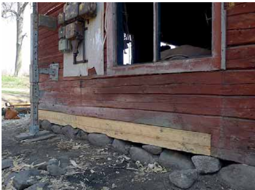
Den nya syllen (här mot väster) anpassades till grundstenarna. Maj -13.