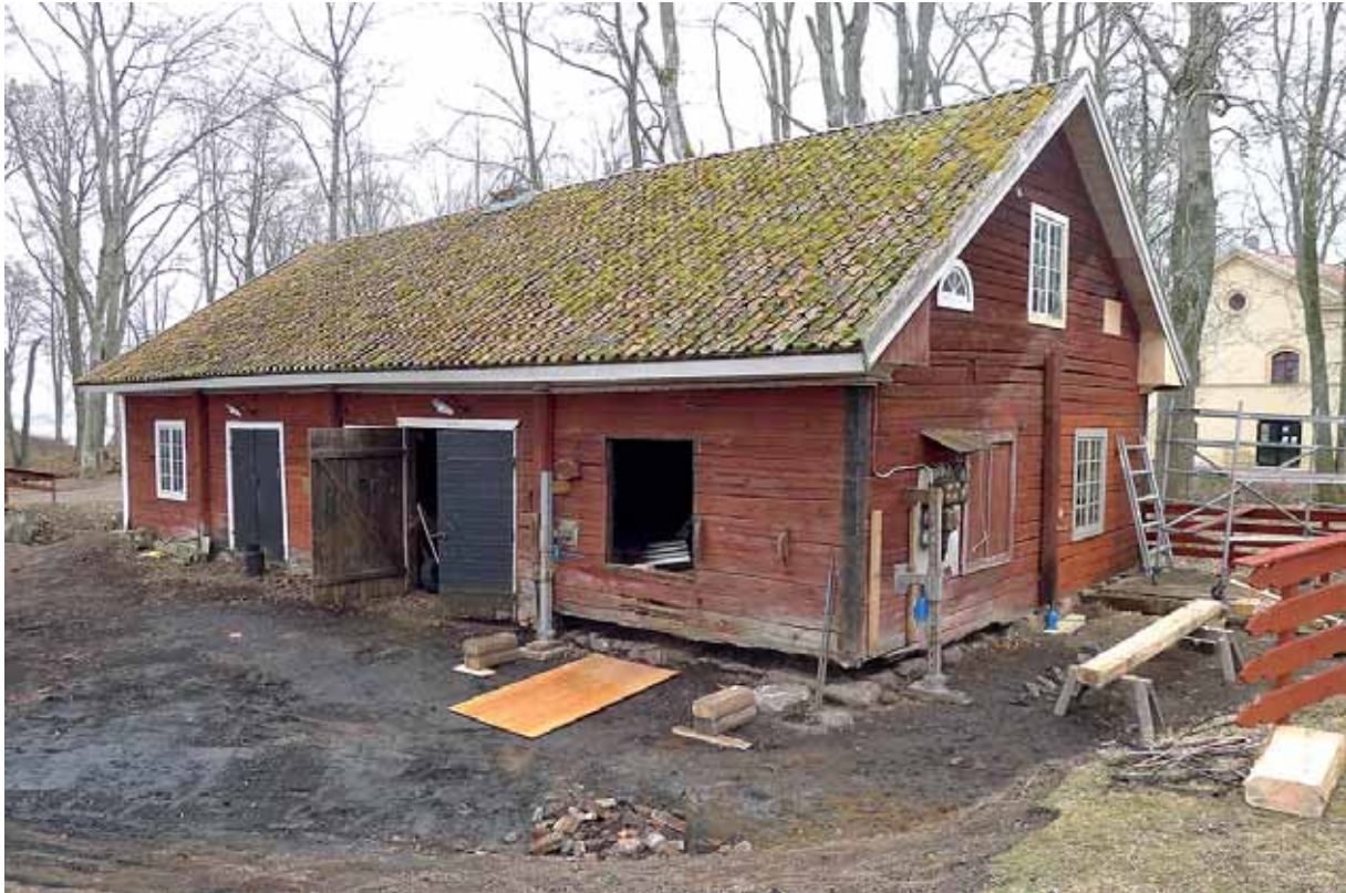
Arbetet påbörjat med byte av skadat timmer i smedjan. April -13.