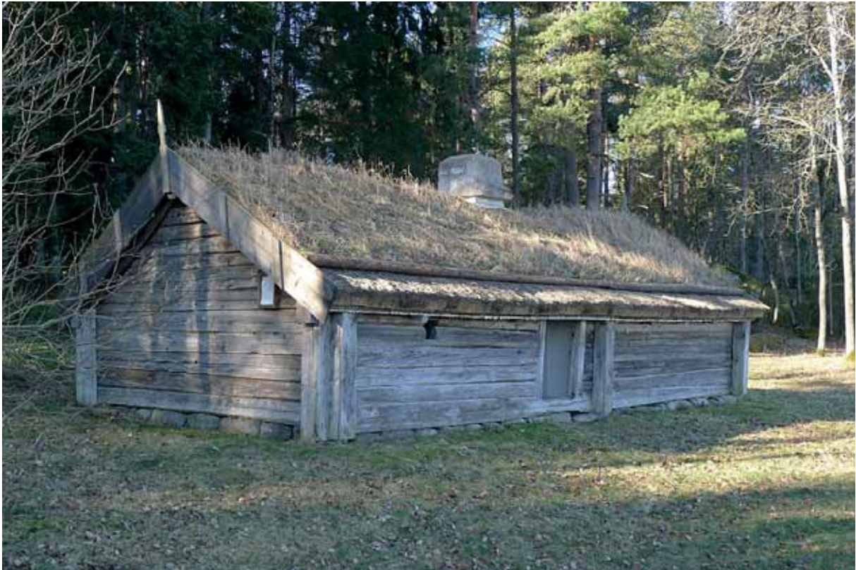
Hyringa fornstuga. Foto mars 2015.