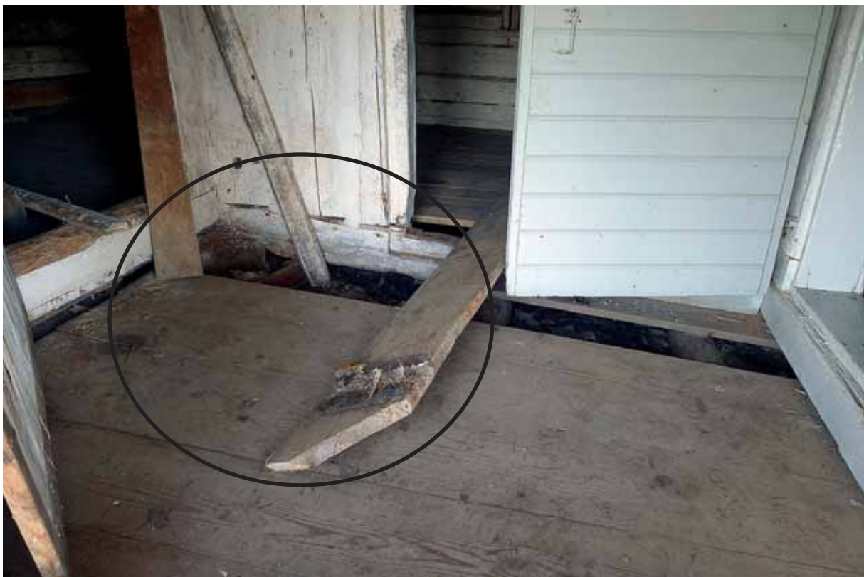
Markeringen visar området för "kärnan" i hussvampsangreppet i förstugan. Den uppbrutna golvbrädan bär mycel efter svampen. Mars 2015.