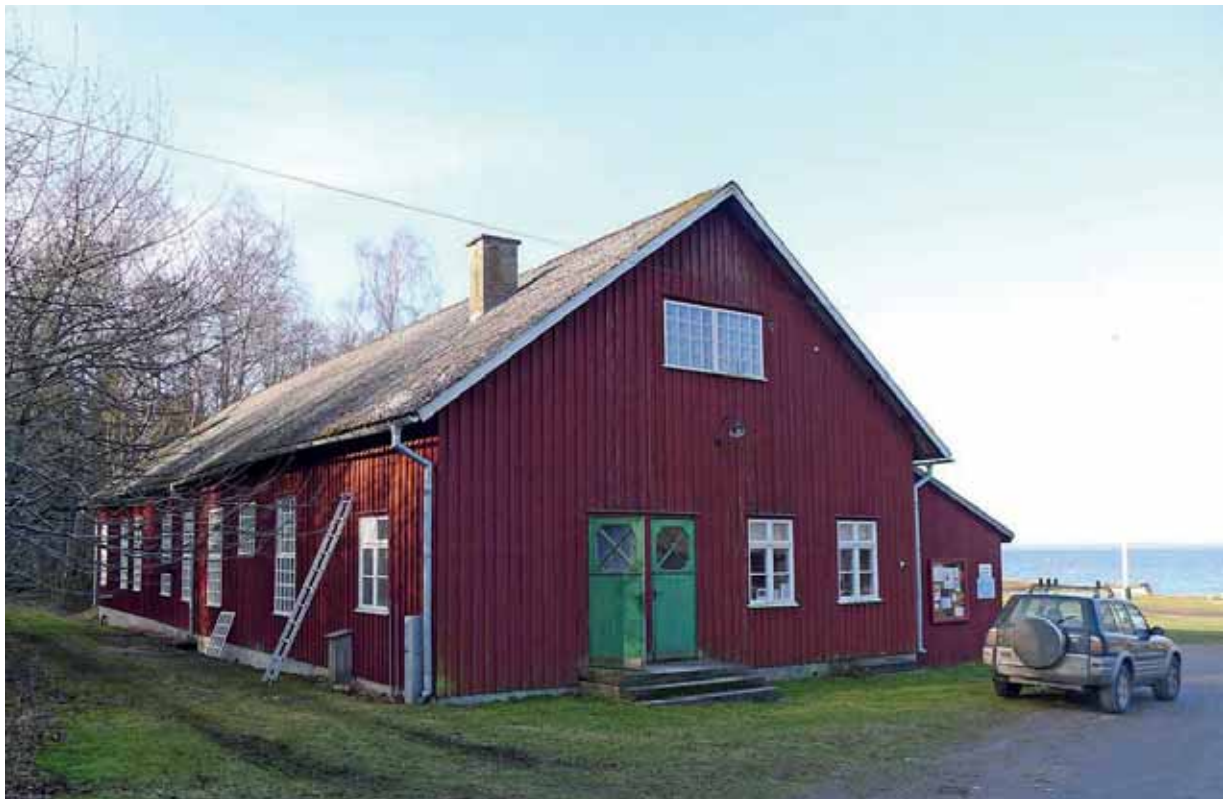
Ovan: Fönsterbågarna under återmontering. Fasad mot öster och norr (närmast). Febr. 2015. Nedan: Del av fasad mot väster, efter renovering av de närmaste två fönstren. Febr. 2015