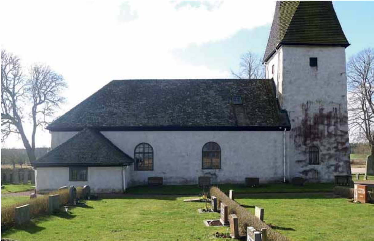
Delar av kyrkan, särskilt tornet, var beväxta med rödalger. 2 april 2015.