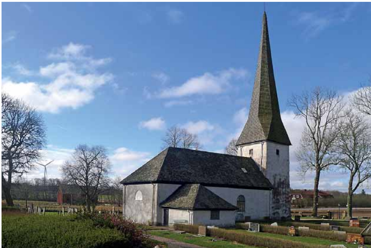
Västra Gerums kyrka från NO före renoveringen. 2 april 2015.