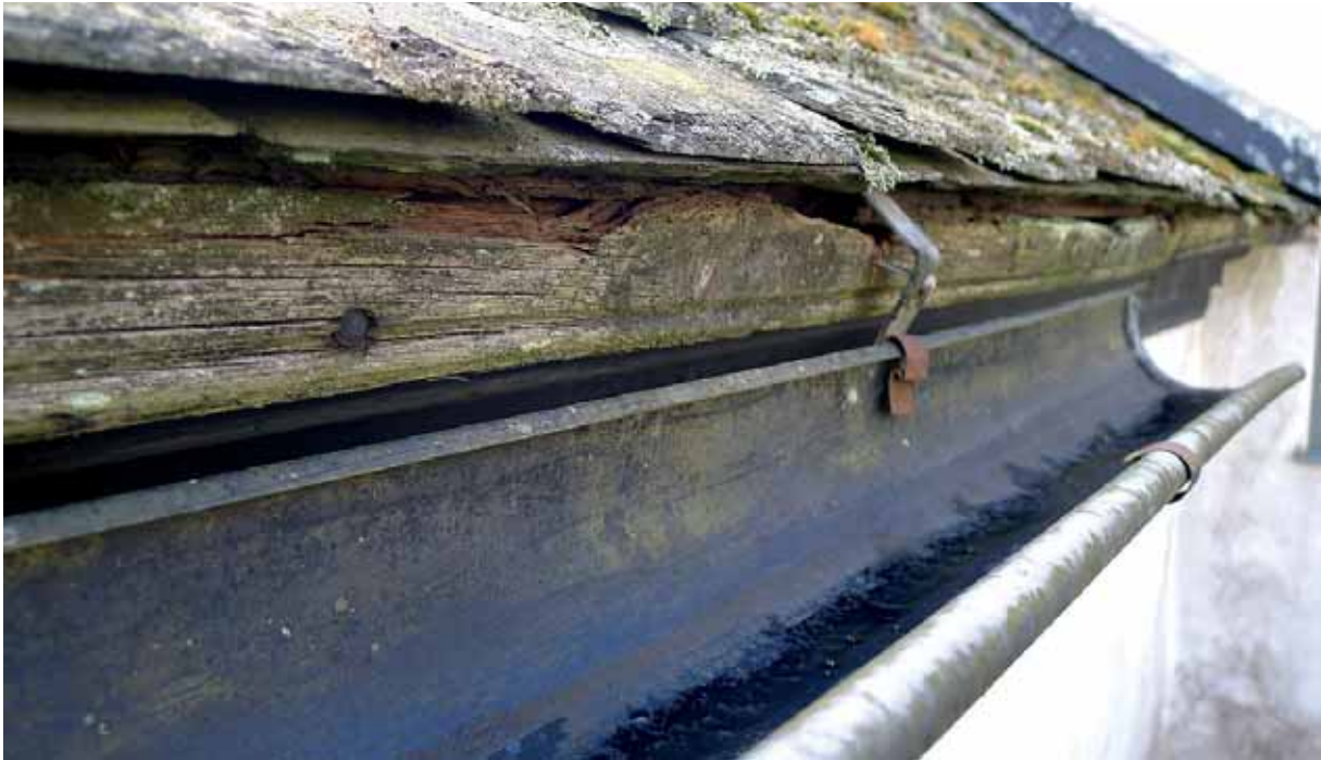
Rötskador i takfotsbräda på sakristian. Notera pärlan i brädans nederkant. 2 april 2015.