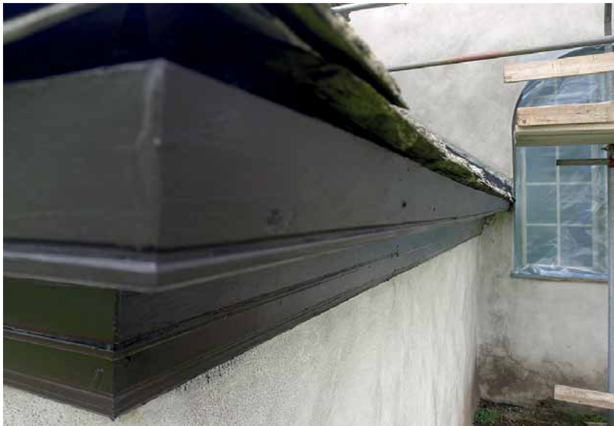
Ny takfotsbräda med profilering lika den äldre. 13 maj 2015.