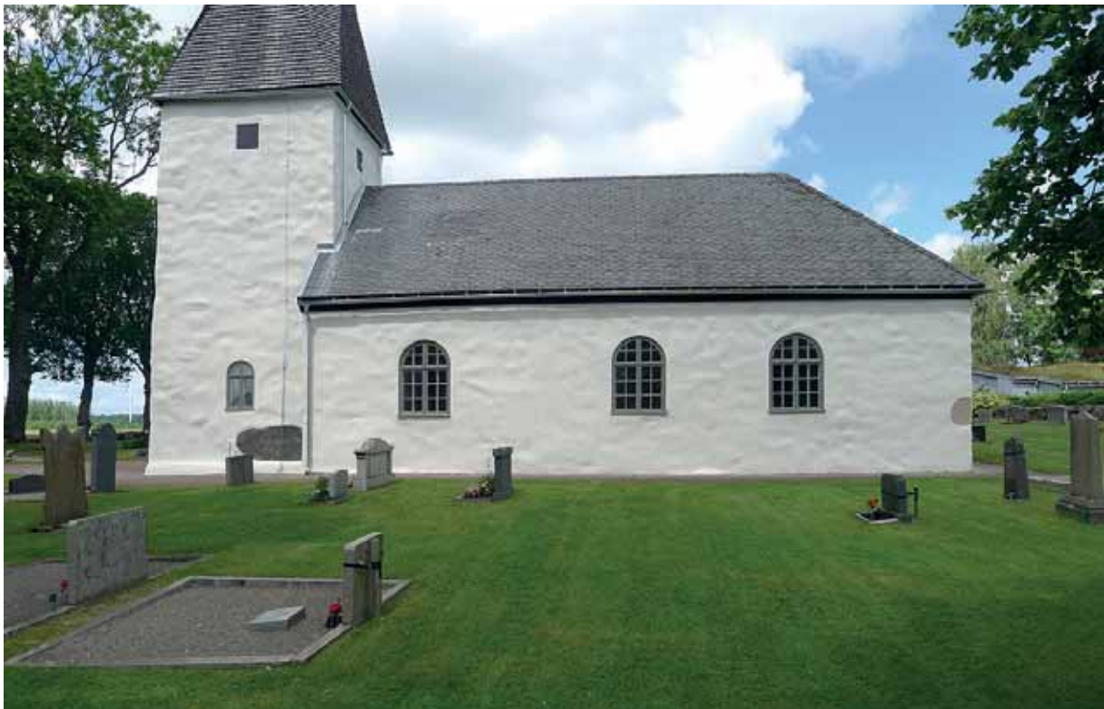
Kyrkans fasad mot söder efter reovering och avfärgning med Hydraulit kc-färg. 30 juni 2015.