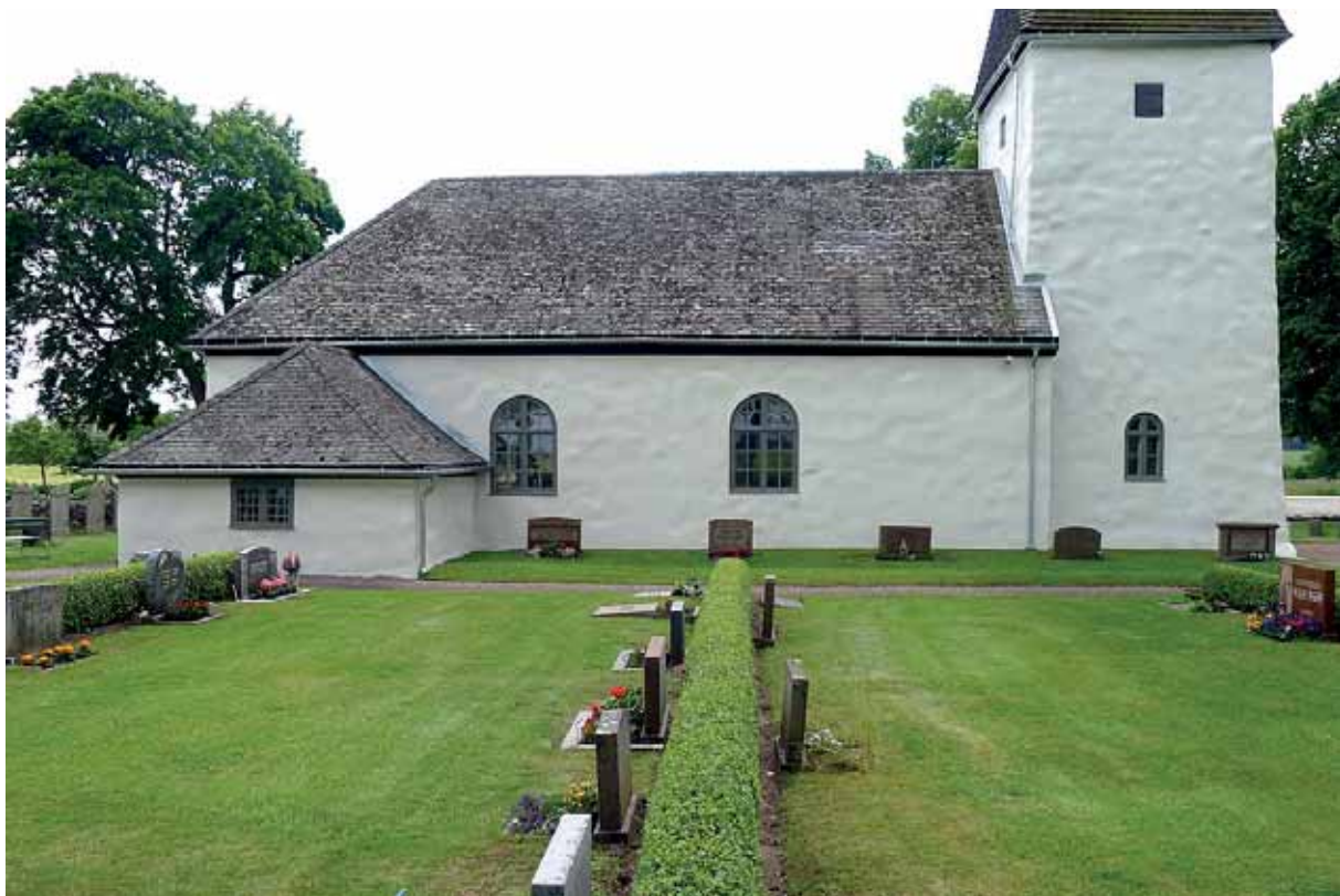
Kyrkans fasad mot norr efter reovering. 30 juni 2015.