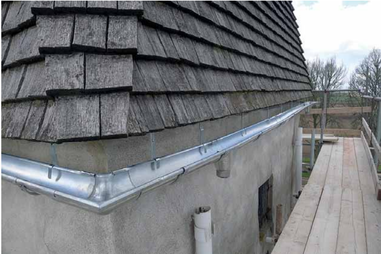
Nya hängrännor på tornet, allt tillverkat av zinkplåt. 6 maj 2015.