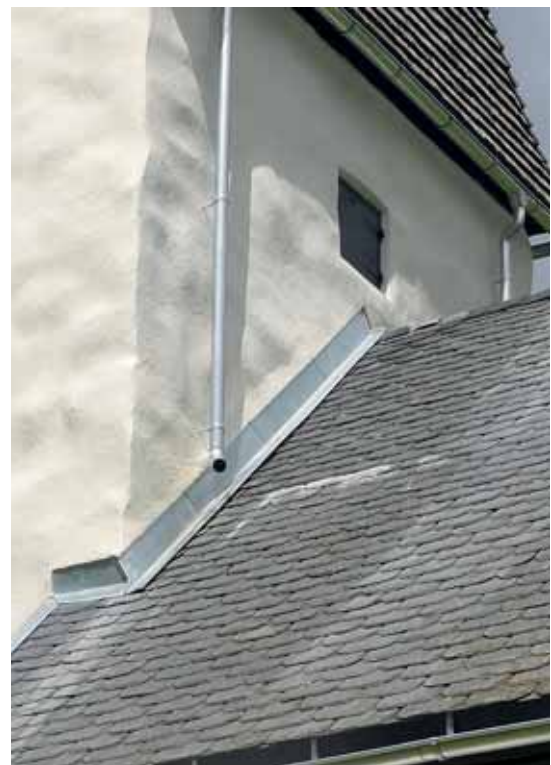
Vänster: Tidigare beslag och stuprör av järnplåt, målade i olika färger. Höger: All plåt byttes nu till zinkplåt som lämnas omålad. 2 april resp. 3 juni 2015.