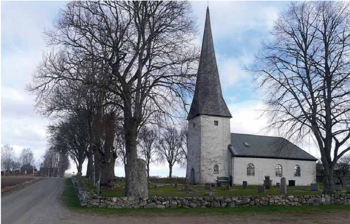
Västra Gerums kyrka från söder före renoveringen. Foto 2 april 2015.