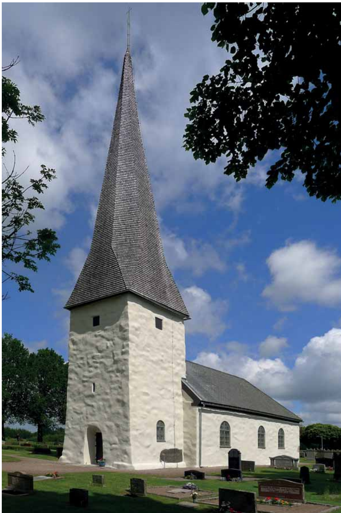
Västra Gerums kyrka efter renowering. 30 juni 2015.