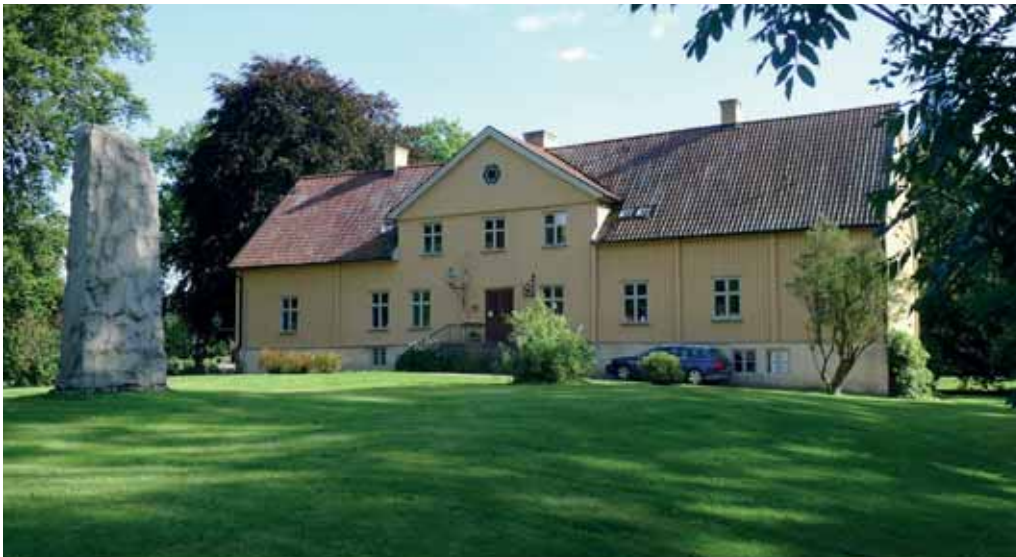
Huvudbyggnaden på veterinärinrättningen, Skara.