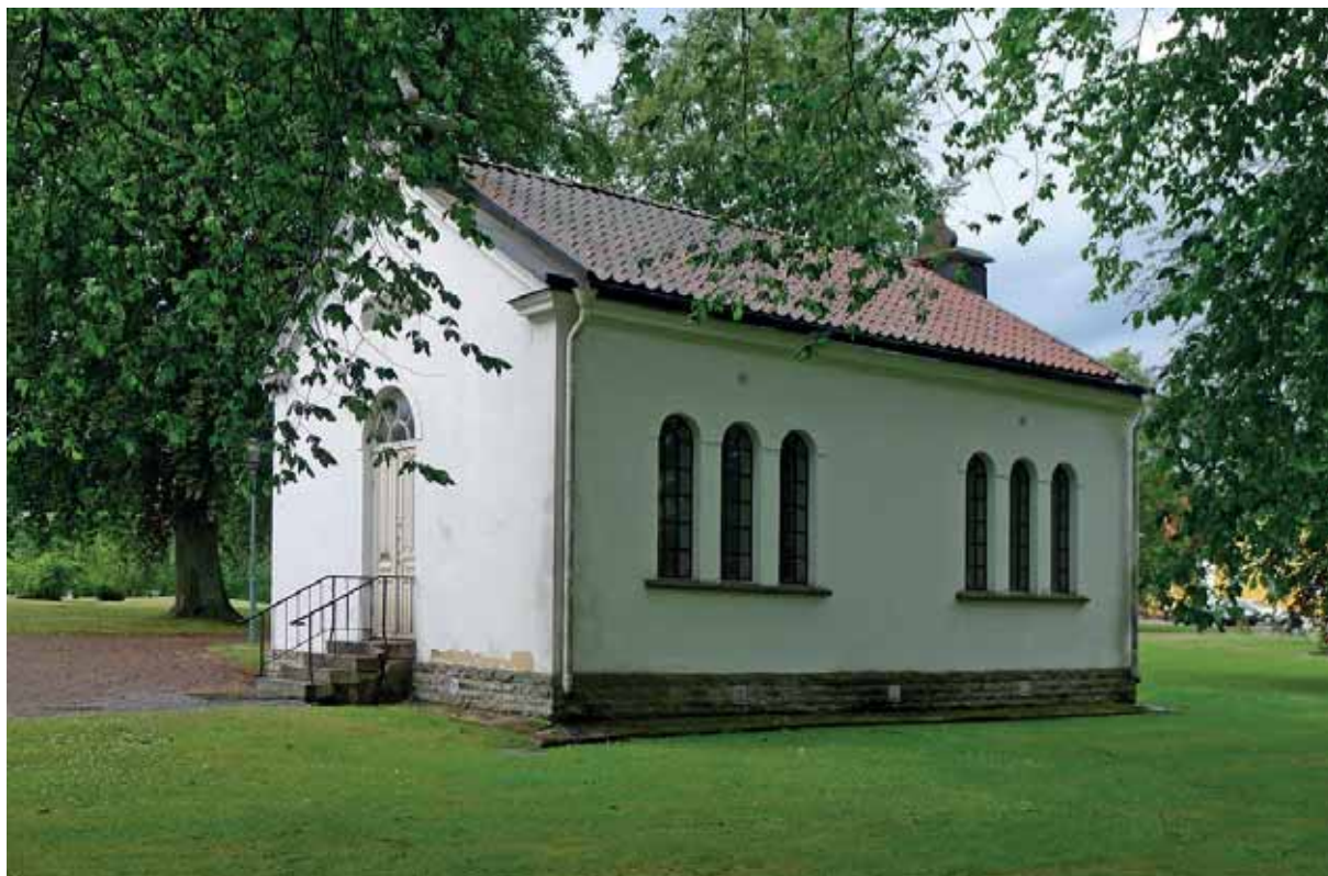
Arkivet på Skara veterinärinrättning före arbetenas påbörjan. Foto 27 juni 2014.