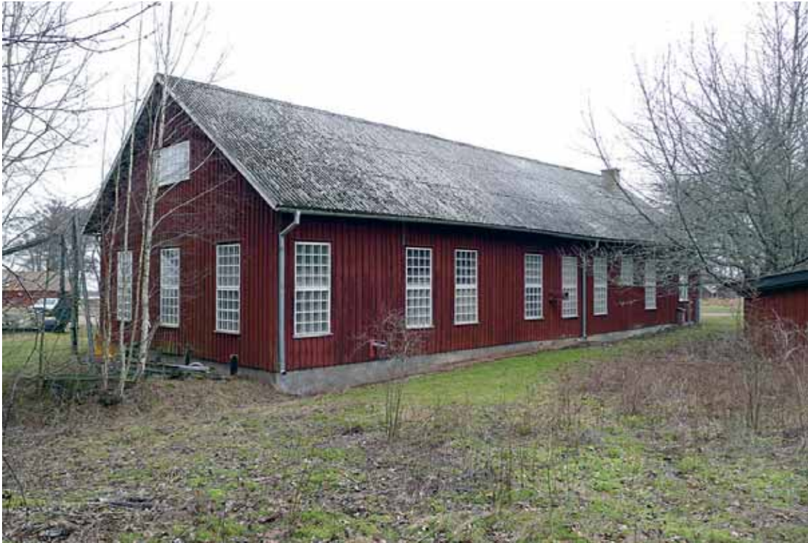
Råbäcks mek. stenhuggeri, Nya verkstaden före renoveringsarbetena. Foto mars 2014.