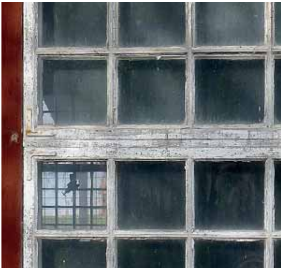
Ovan: Exempel på fönster före renovering.