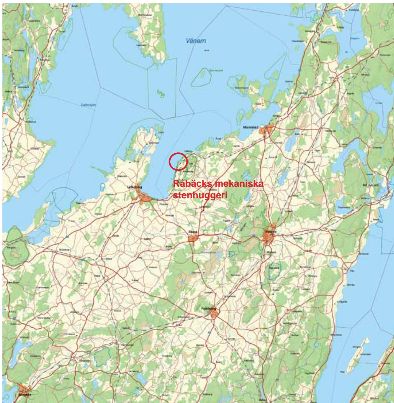
Skaraborgsdelen av Västra Götalands län.