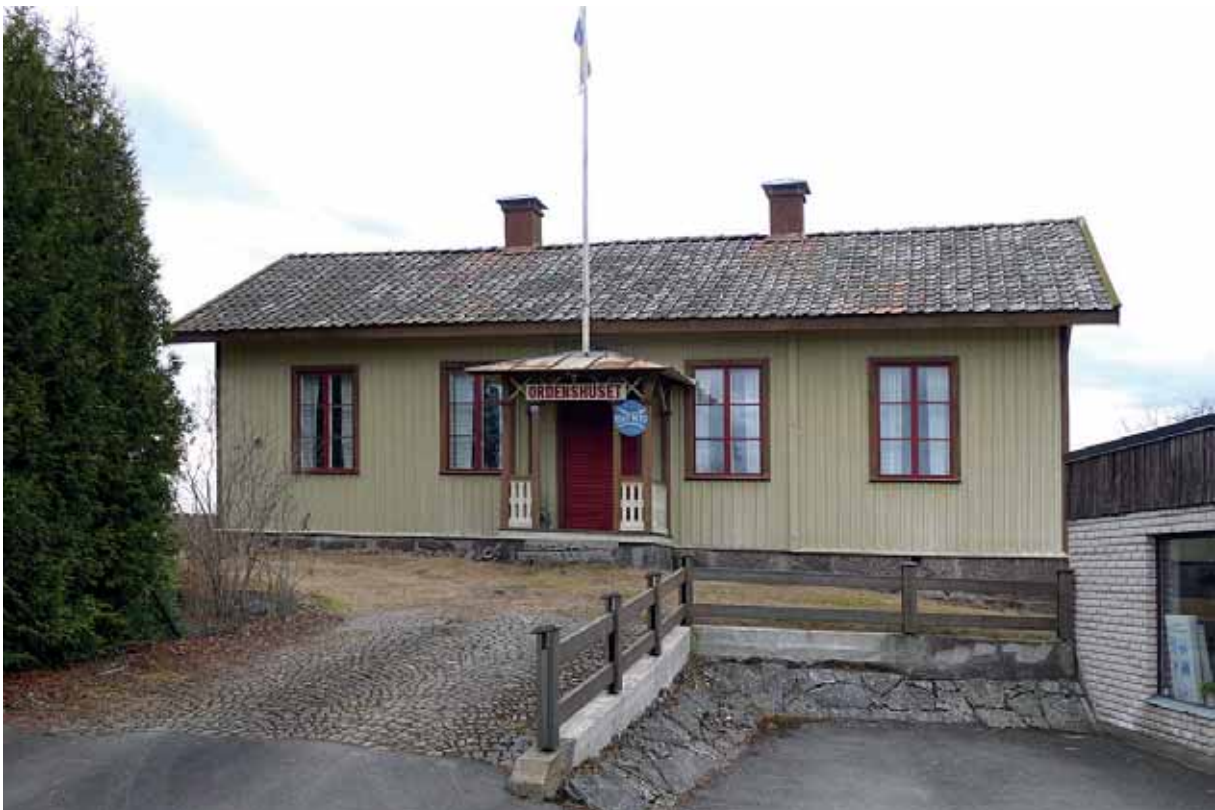
Nedan: Från Västra Drottningvägen. 22 mars 2016.