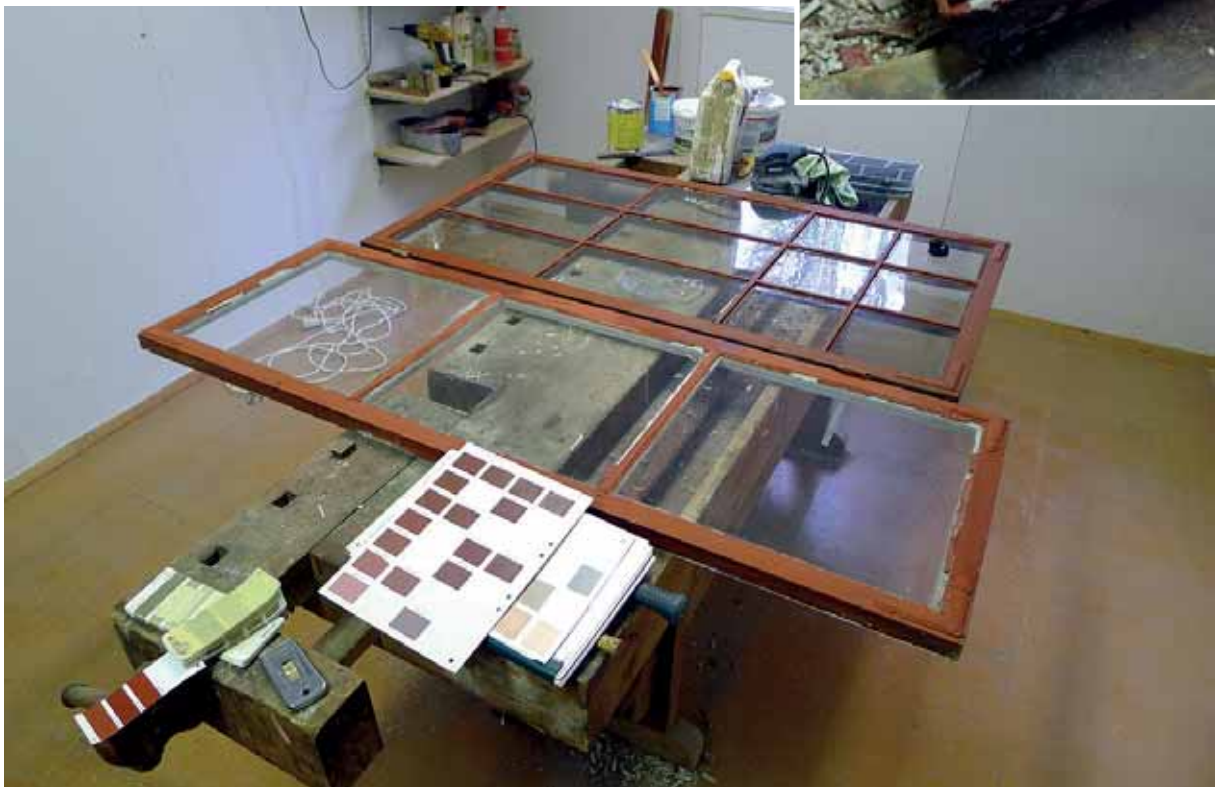
Bestämning av kulör för slutstrykning av bågar. Okt. 2015.