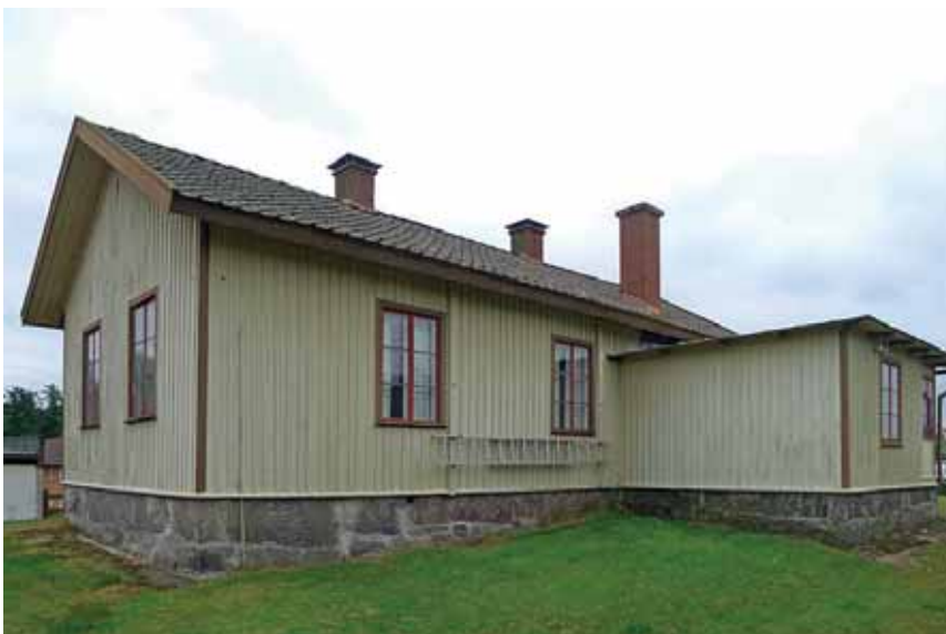
Ordenslokalen sedd från NV. Aug. 2015