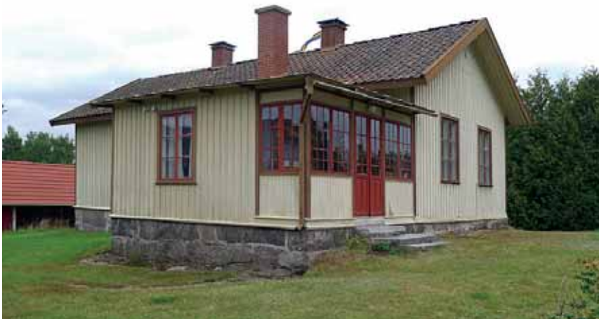
Bibliotek och förstuga tillkom i två etapper omkring 1905. Aug. 2015.