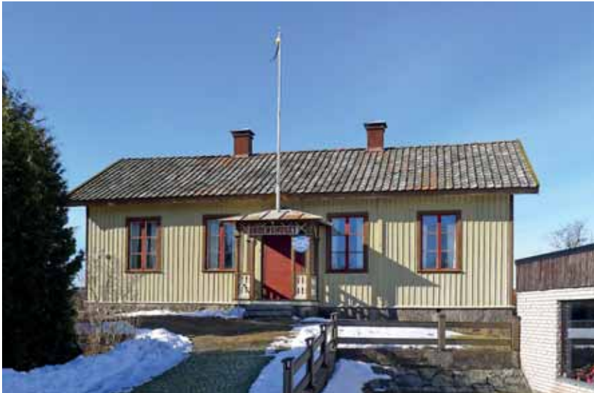
Logen Vulcan ligger på en sticktomt något indragen från Västra Drottningvägen. Foto mars 2013.