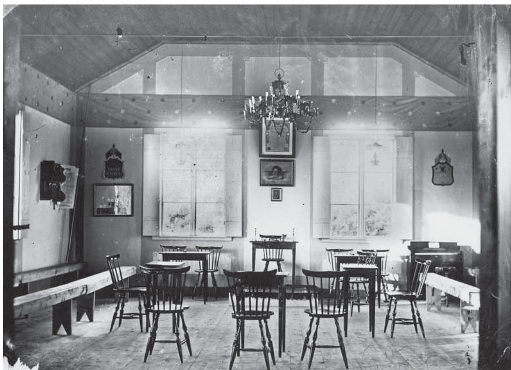
Logen Vulcan, ursprunglig interiör 1880-tal. Notera fönsterluckorna.

Ordenshuset var Tidaholms första profana samlingslokal och kom därigenom att bli viktig även för arbetarrörelsens framväxt på orten. Ordenshuset var också tidigt sett ur ett nationellt perspektiv - Sveriges första IOGT-lokal byggdes endast två år innan i Arboga. Vid invigningen 1883 fick lokalen namnet Nordstjernen. Logebyggnaden är uppförd av timmer i en våning med oinredd vind. Hela byggnaden utgörs av en enda lokal - ordenssalen. Rummet har fönster åt alla fyra väderstreck. Ordenshuset tillbyggdes år 1906 med en vinkelbyggnad innehållande förstuga och bibliotek med en öppen veranda eller förstukvist. Denna byggdes efter en tid in till en glasveranda med småspröjsade fönster, troligen redan omkring 1910 eller snart därefter. Dessförinnan hade redan 1904 en liten vaktmästarbostad byggts på gården bakom ordenshuset. Därefter har inga väsentliga förändringar skett, annat än ommurning av skorstenen till kaminen. Båda husen är enkla byggnader, inte olika ordinära bostadshus från tiden kring sekelskiftet 1900.