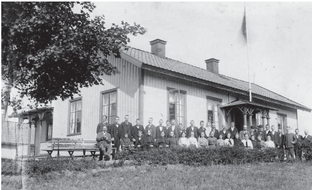
Logen Vulcan, exteriör, ca 1910.