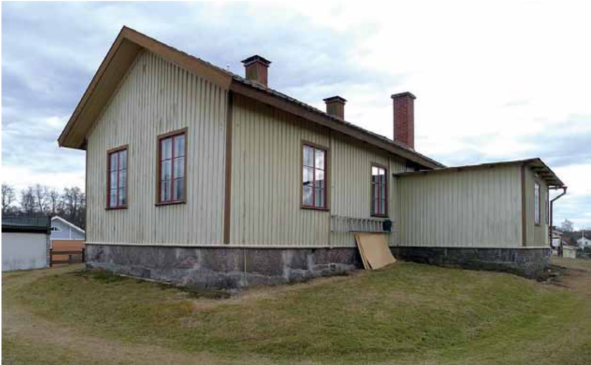
Ovan: Logen Vulcan sedd från NV. 22 mars 2016.