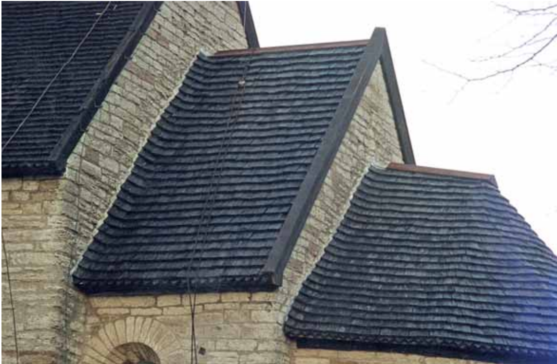
Koret och absiden efter avslutad nytäckning. 4 dec. 2000. 00/375.