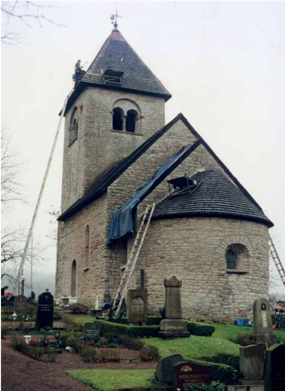
Våmbs kyrka - nyläggning av spån har pågått några dagar. Foto 15 nov. 2000. Film 00/378.