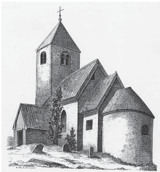
Våmb's kyrka före 1897 års restaurering. Xylografi av Evald Hansen, trol. i Ny Illustrerad Tidning.

I Peringskiölds Monumenta från 1670-talet har kyrkans torn sadeltak. 1773 fick kyrkan sin predikstol. Kyrkan renoverades 1790 och putsades invändigt samt fick takmålningar i form av nät och bandbågar. Vid 1800-talets slut var kyrkan mycket förfallen. En insamling ledde 1897-1898 till att kyrkan kunde upprustas. Murar lagades och förstärktes med järn, väggar lagades och grunden förstärktes. Man tog bort en läktare i väster samt den gamla predikstolen. Bänkar byttes ut mot stolar. Väggarna invändigt vitkalkades, förutom nedre