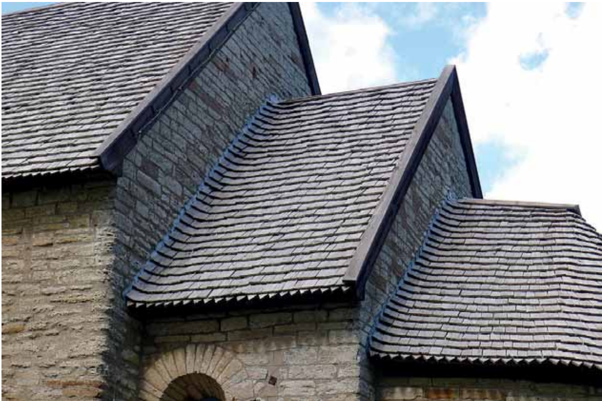
Samma parti som ovan, 16 år och en omtjärning (år 2010) senare. 17 maj 2016.