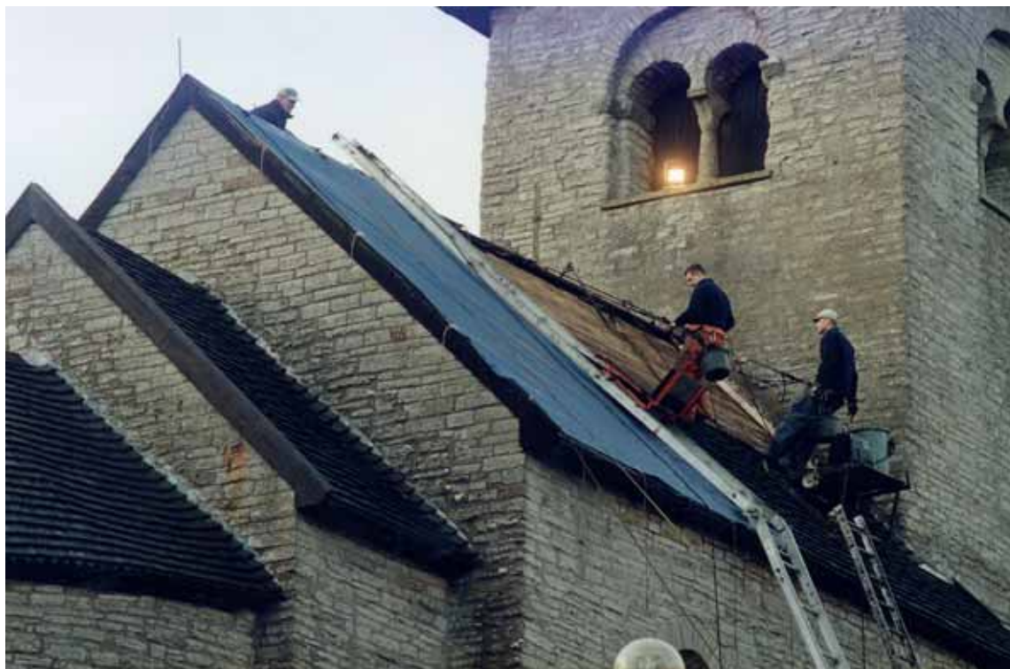
Täckning pågår av långhusets norra takfall. 4 dec. 2000. 00/375.