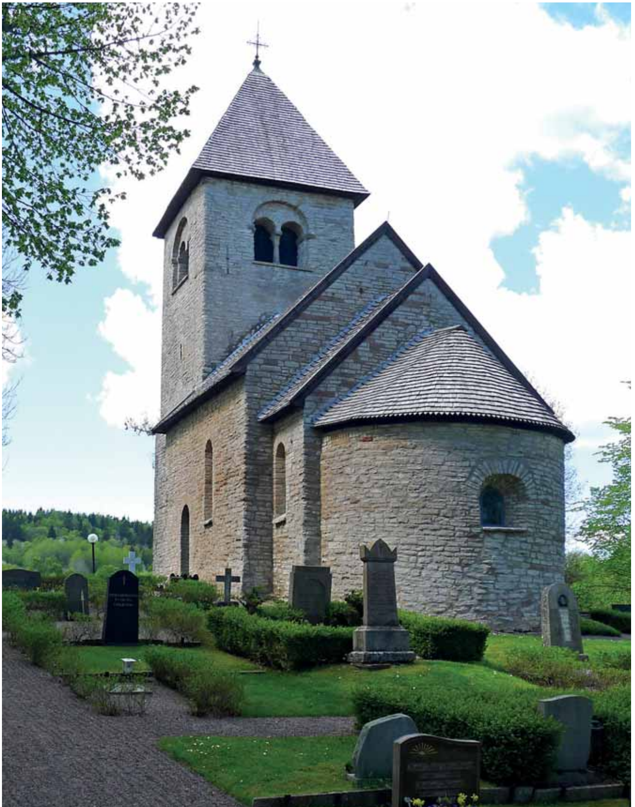
Våmbs kyrka 17 maj 2016.