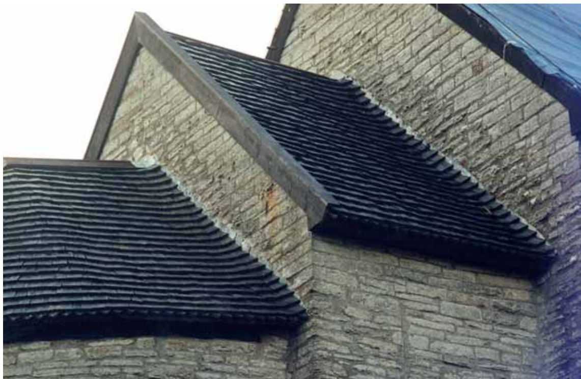
På bilden syns tydligt hur spåntäckningen ansluter till väggarna efter nytäckningen. Alla vindskivor byttes också mot tjärad furu. 4 dec. 2000. 00/375.