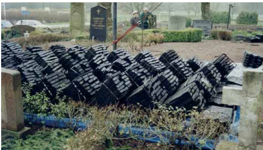
Kluvna ekspån, fördopade i varm tjära, gör att varje spån blir behandlat på alla sidor. 15 nov. 2000. 00/377.